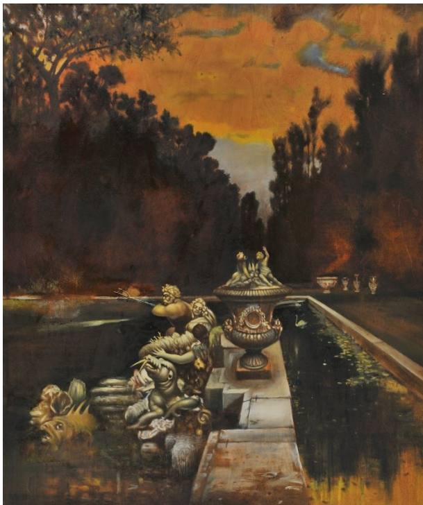
Slika 9. : Josip Leović, Bazen u kraljevskom parku, 3.des. 20.st.