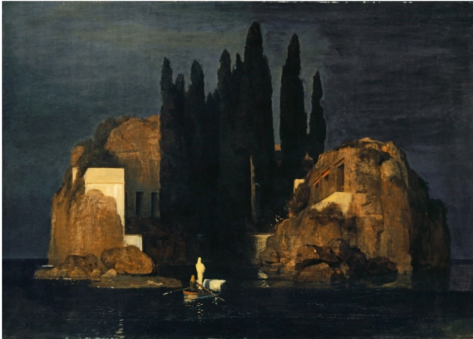
Slika 15.: Arnold Böcklin, Otok mrtvih, 1880.