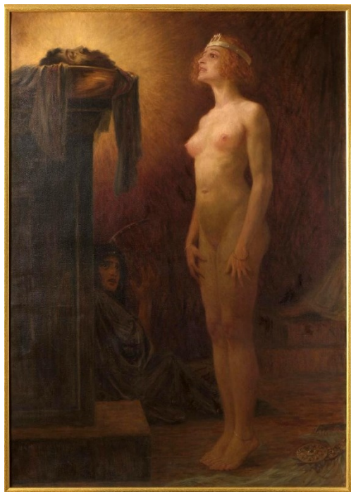
Slika 6.: Bela Čikoš Sesija, Saloma, 1909.

Preuzeto iz: Zlamalik Vinko, Bela Čikoš Sesija, začetnik simbolizma u Hrvatskoj (Zagreb: Jugoslavenska akademija znanosti i umjetnosti, Društvo povjesničara umjetnosti Hrvatske, 1984)