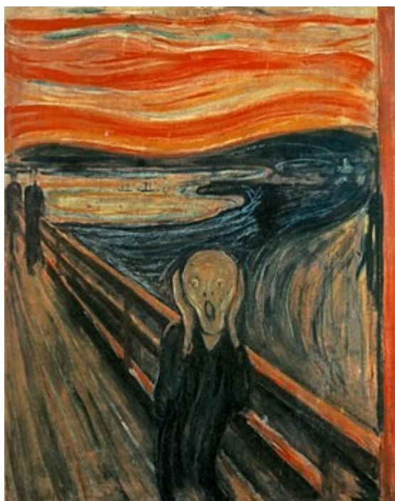
Slika 2.: Edvard Munch, Krik, 1893.

Preuzeto sa: https://artincontext.org/james-ensor/