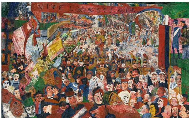
Slika 1.: James Ensor, Krist ulazi u Bruxelles, 1888.