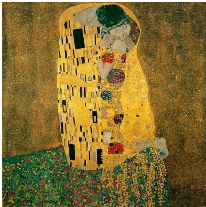
Slika 4.: Gustav Klimt, Poljubac, 1907.