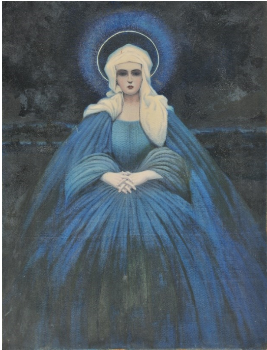
Slika 13.: Josip Leović, Majka Božja, 3.des. 20.st.