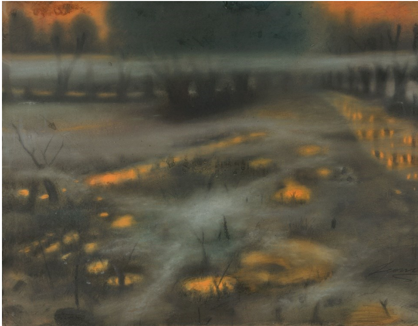
Slika 8.: Josip Leović, Močvarne magle, 1927.