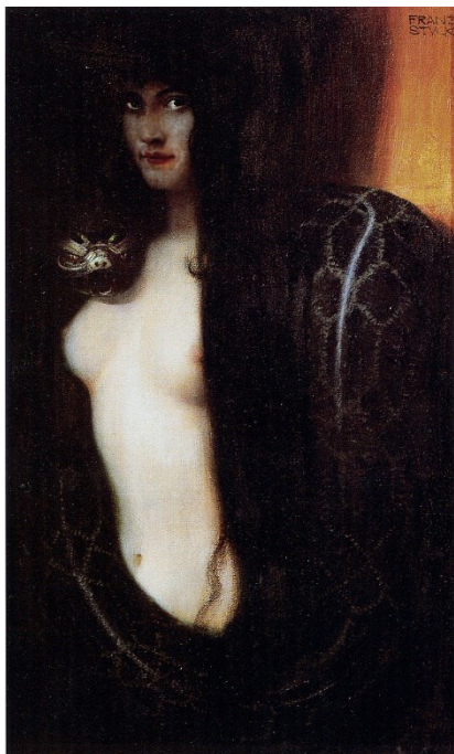
Slika 3.: Franz von Stuck, Grijeh, 1893.