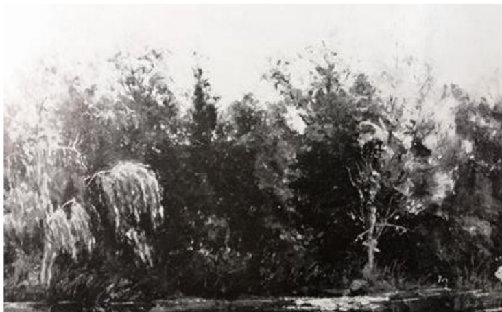
Slika 5.: Bela Čikoš Sesija, Park u Dardi, 1884.

Preuzeto iz: Zlamalik Vinko, Bela Čikoš Sesija, začetnik simbolizma u Hrvatskoj (Zagreb: Jugoslavenska akademija znanosti i umjetnosti, Društvo povjesničara umjetnosti Hrvatske, 1984)