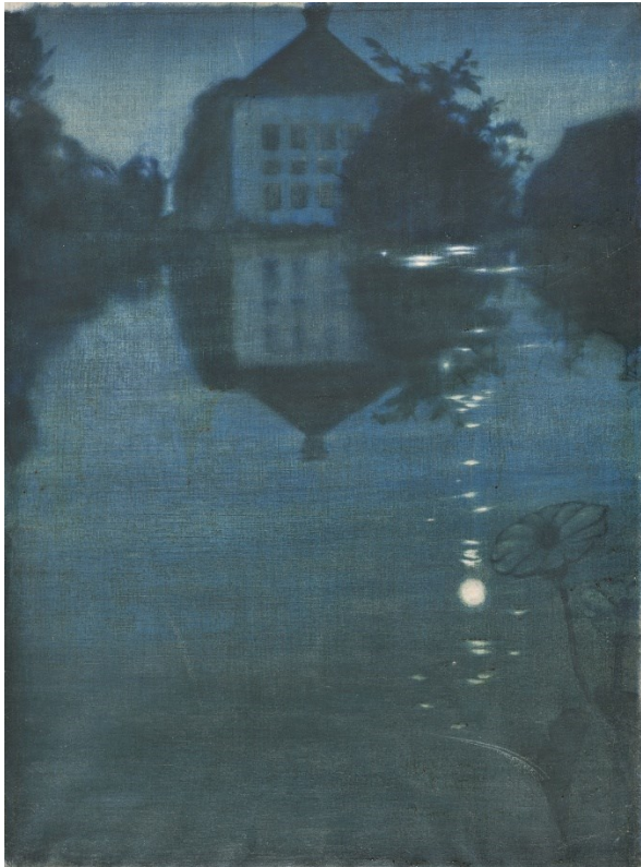
Slika 11.: Josip Leović, Mjesečina, 3.des. 20.st.