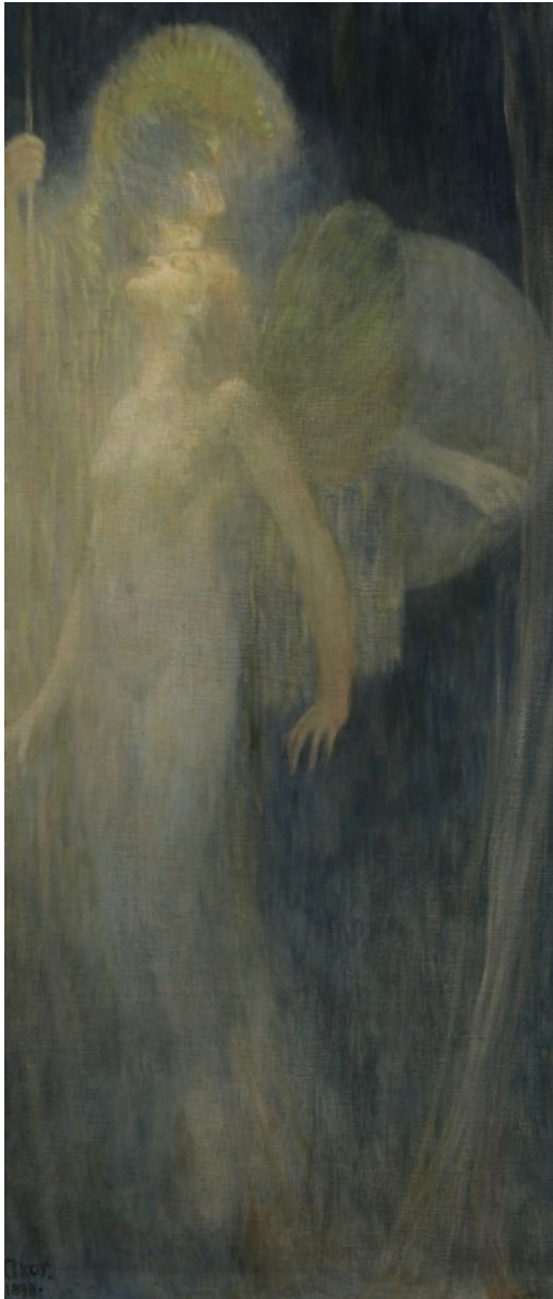
Slika 7. : Bela Čikoš Sesija, Psiha, 1898.