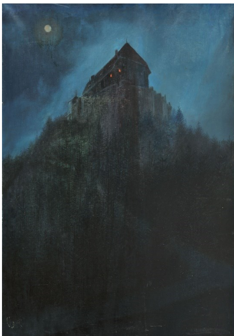
Slika 12.: Josip Leović, Dvorac, 3.des. 20.st.