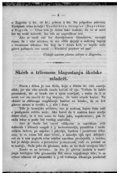
Slika 1. Učitelji uzorne glavne učione u Zagrebu. Program. // Napredak 1, 1 (1859.), str. 1-4.