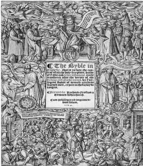
Slika 3. Naslovna stranica prve Biblije prevedene na engleski jezik 1539. g. – alegorijski prikaz Henrika kao novog vrhovnog autoriteta Crkve u Engleskoj

podjela počela se zamjenjivati individualnim religijskim pitanjem koji se istaknuo kao iznimno složen, uvjetovan djelovanjem državnih činovnika i pokoravanjem pojedinaca. Stoga se radilo o važnom problemu s kojim su se Henrik VIII. i Anglikanska Crkva morali suočiti, koje će trajati do kraja 16. stoljeća. 36