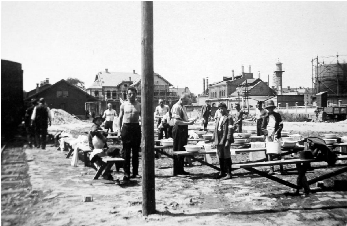
Prilog 1: Odbor za podvorbu vojnika na glavnom kolodvoru.

opasnosti od širenja kolere, no članovi odbora nastavili su pomagati vojsci tako što su izrađivali pokrivače i obojke za vojnike. 61