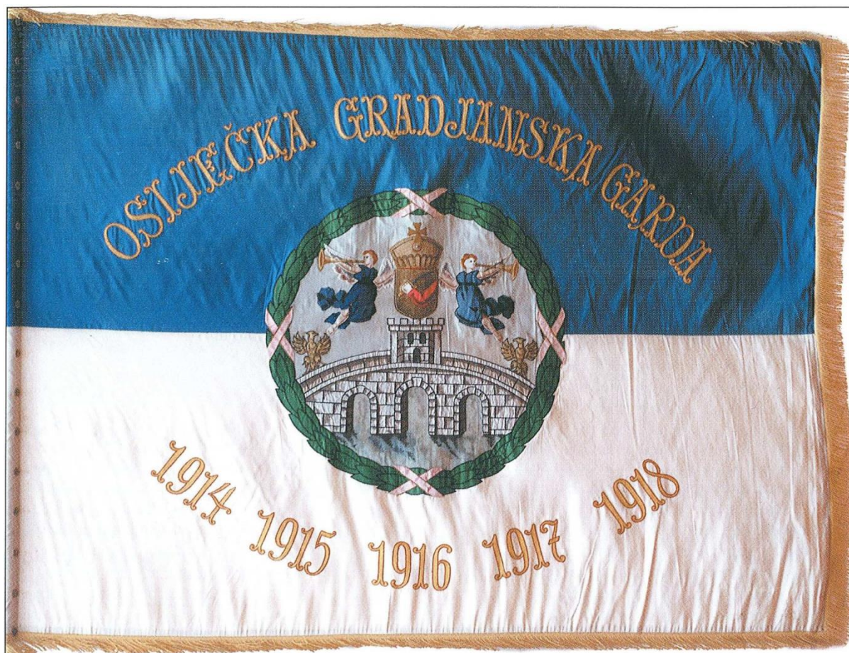
Prilog 3: Zastava Građanske garde.

Na početku rata, stopa kriminala je pala, ali se osječko redarstvo moralo suočiti sa drugim problemom, dolaskom stranaca u grad, prvenstveno zarobljenika sa bojišnice. Pojačan redarstveni nadzor vršio se nad političkim sumnjivcima te strancima koji su prolazili kroz grad. Pozitivan odjek dali su gradski apeli stanovništvu da pomogne pri otkrivanju i prijavi sumnjivih osoba. Osim brige o nepoželjnim osobama u gradu, redarstvo je ulagalo velike napore pri smještaju vojnika koji su kratko ostajali u gradu prije nego što su otpremljeni na front. Budući da je pažnja redarstva bila usmjerena prema navedenim aktivnostima, građanska garda bavila se cestovnim redarstvom, čistoćom u gradu, pogotovo tijekom pojave kolere u gradu, održavanjem reda u trgovinama te je pazila na sigurnost osoba i imovine, uz pomoć pri prijevozu ranjenika s kolodvora do osječkih bolnica. Osobito važna bila je kontrola trgovina, odnosno cijena namirnica, jer je od početka rata cijena namirnica naglo rasla, što je gradsko poglavarstvo navelo na limitiranje cijena. Tako je građanska garda imala važan posao