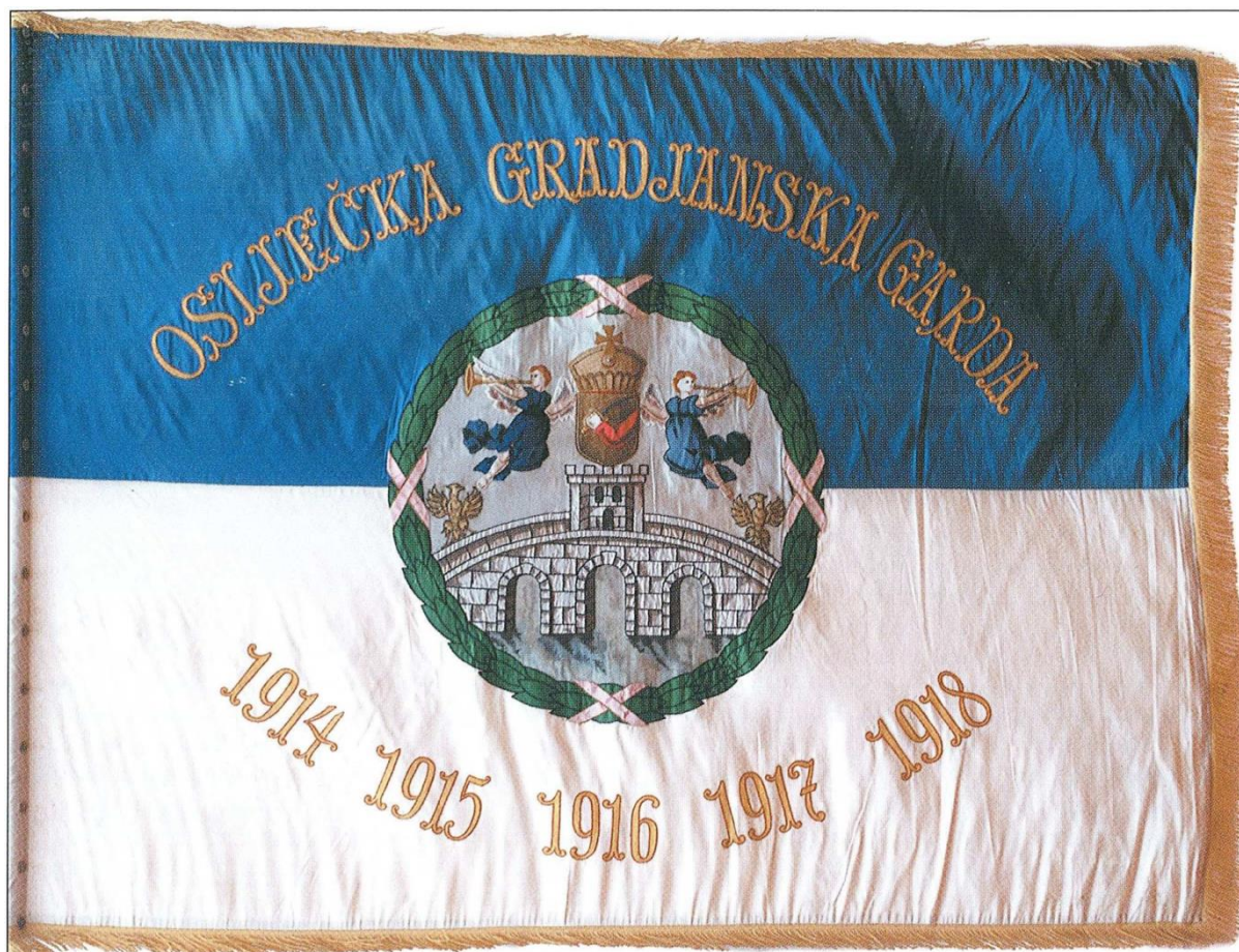
Prilog 3: Zastava Građanske garde.

Na početku rata, stopa kriminala je pala, ali se osječko redarstvo moralo suočiti sa drugim problemom, dolaskom stranaca u grad, prvenstveno zarobljenika sa bojišnice. Pojačan redarstveni nadzor vršio se nad političkim sumnjivcima te strancima koji su prolazili kroz grad. Pozitivan odjek dali su gradski apeli stanovništvu da pomogne pri otkrivanju i prijavi sumnjivih osoba. Osim brige o nepoželjnim osobama u gradu, redarstvo je ulagalo velike napore pri smještaju vojnika koji su kratko ostajali u gradu prije nego što su otpremljeni na front. Budući da je pažnja redarstva bila usmjerena prema navedenim aktivnostima, građanska garda bavila se cestovnim redarstvom, čistoćom u gradu, pogotovo tijekom pojave kolere u gradu, održavanjem reda u trgovinama te je pazila na sigurnost osoba i imovine, uz pomoć pri prijevozu ranjenika s kolodvora do osječkih bolnica. Osobito važna bila je kontrola trgovina, odnosno cijena namirnica, jer je od početka rata cijena namirnica naglo rasla, što je gradsko poglavarstvo navelo na limitiranje cijena. Tako je građanska garda imala važan posao