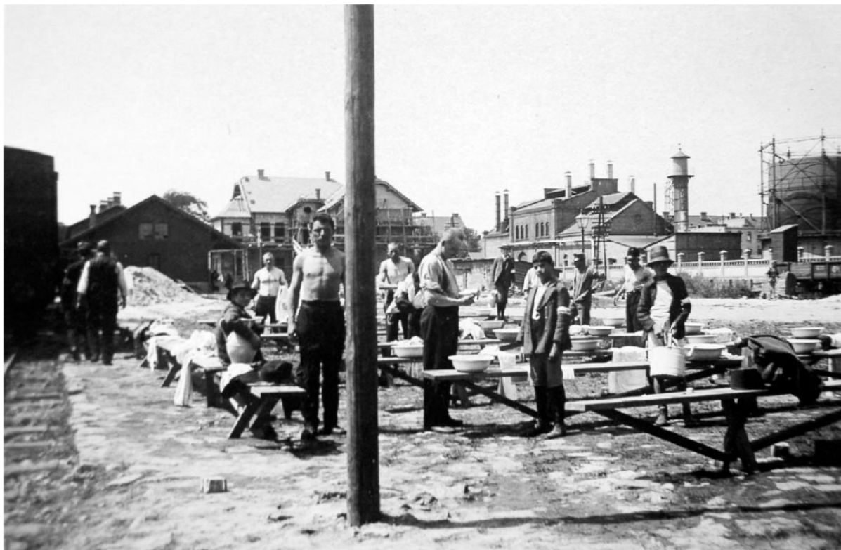
Prilog 1: Odbor za podvorbu vojnika na glavnom kolodvoru.

opasnosti od širenja kolere, no članovi odbora nastavili su pomagati vojsci tako što su izrađivali pokrivače i obojke za vojnike. 61