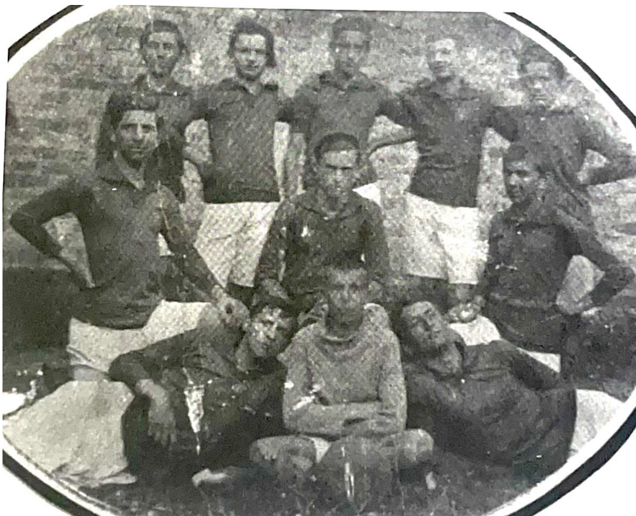
Prilog 4: Fotografija momčadi Slavije s prve utakmice, 17. rujna 1916.