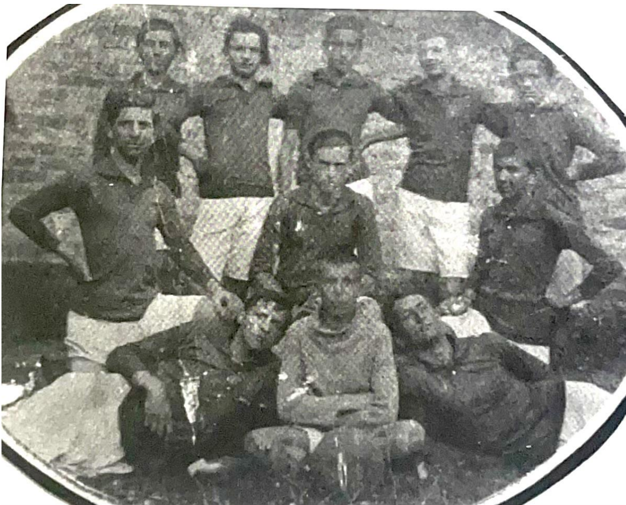
Prilog 4: Fotografija momčadi Slavije s prve utakmice, 17. rujna 1916.