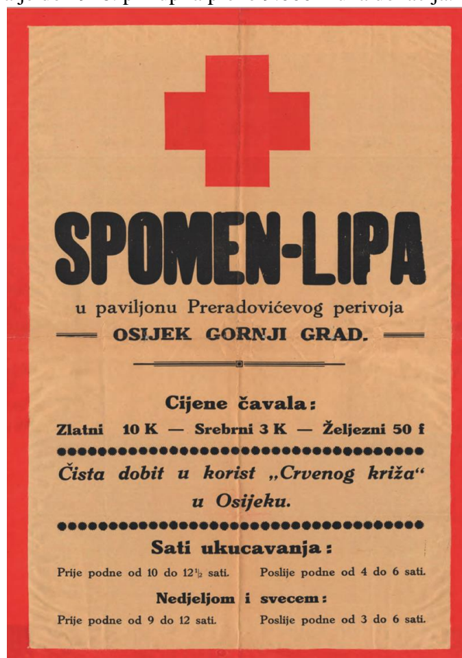
Prilog 2: Plakat Spomen-lipe koja se nalazila u današnjem Sakuntala parku.

koštao je 10 kruna, srebrni 3 krune, a željezni 50 filira. Sav prikupljen novac išao je Crvenom križu. 143 Spomen-lipa je do 1918. prikupila preko 9.000 kruna donacija. 144