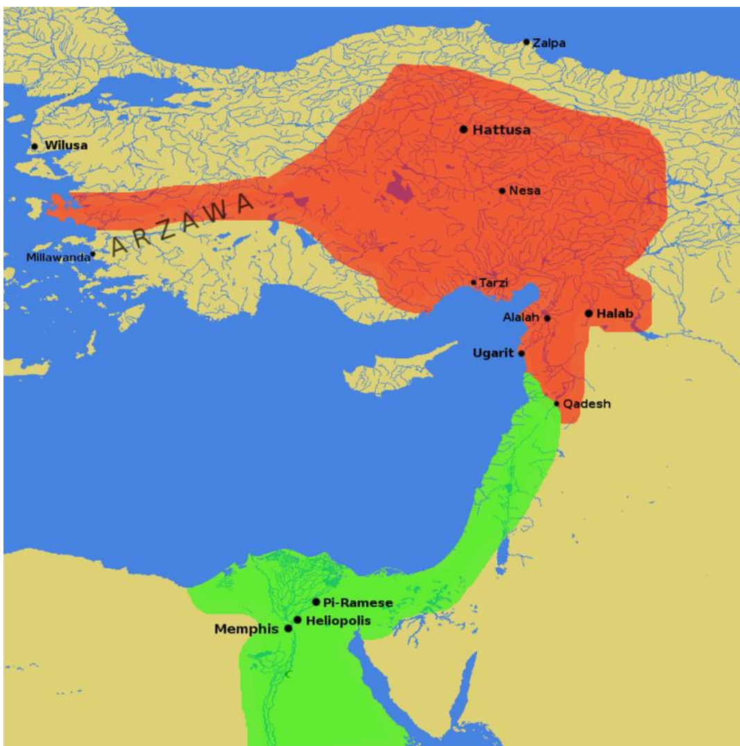
Prilog 1. Egipatsko carstvo i Hetitsko Kraljevstvo neposredno pred bitku kod Kadeša 12

Bombastična izvješća o bitki i osobnoj hrabrosti Ramsesa II. vođenog Amonovom rukom ostali su po zidovima hramova u Karnaku, Luxoru (tri verzije), u Ramasseumu (dvaput), u Abydosu i Abu Simbelu. Također su ostali mnogi zapisi o bitki i na papirusu.