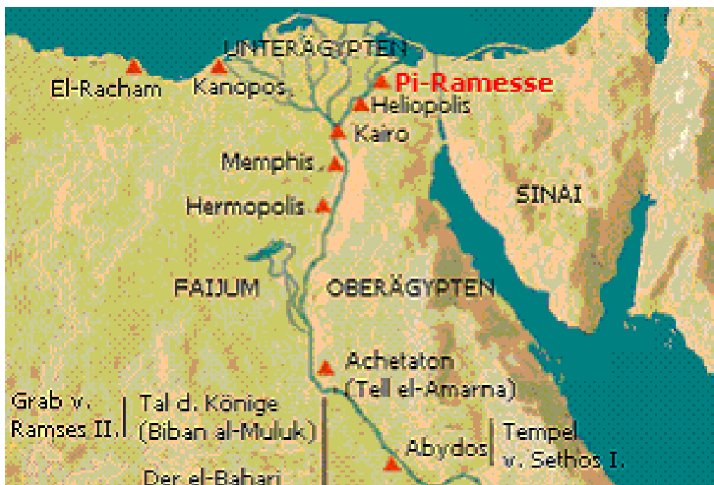
Prilog 3. Položaj nove prijestolnice-Piramese unutar Egipatskoga carstva 18