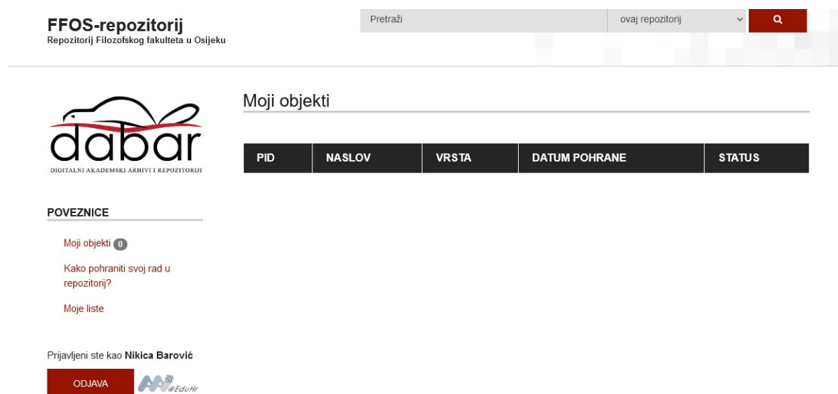
Slika 2. Stranica koja se prikazuje prilikom ulaska u sustav FFOS-repozitorija 32

Kako je repozitorij izrađen pod sustavom Dabar, korisnici, ponajprije studenti, prijavljuju se preko svoje AAI@EduHr domene, nakon toga mogu vidjeti popis svojih objekata ako su ih prethodno postavili. 31