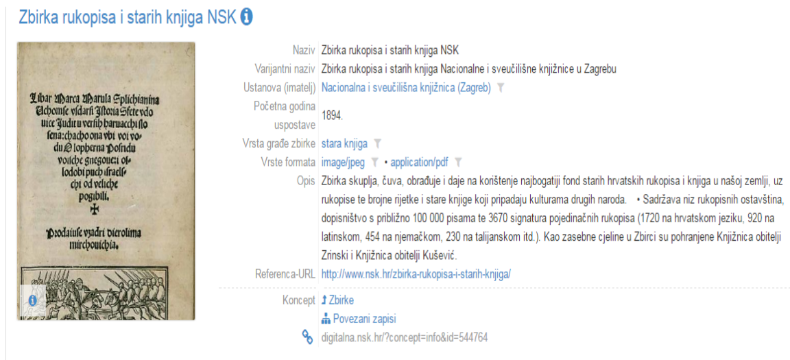
Slika 1. Fotografija primjene Dublin Core sheme metapodataka za opis zbirke u NSK

suradnika. Osim toga, portal NSK sadrži i virtualne izložbe Ruđera Boškovića, Antuna Gustava Matoša, 1914. i ostale. 36