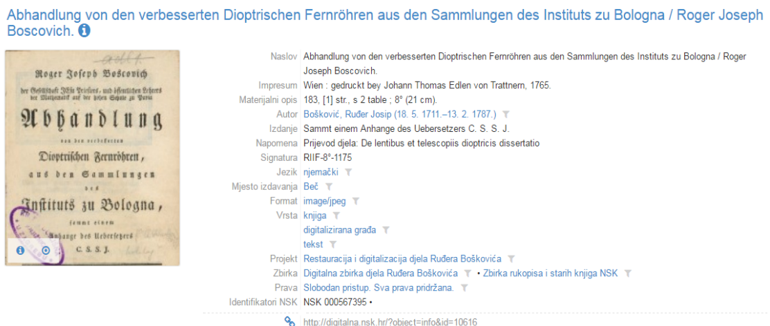
Slika 2. Fotografija primjene Dublin Core sheme metapodataka za opis djela u NSK