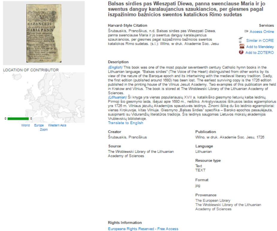
Slika 7. Fotografija primjene Dublin Core sheme metapodataka za opis građe u European Library

„Plan du port de Veruda“ te „Hrvatska crkvena pjesmarica“. Cilj Europske komisije je nastaviti digitalizirati građu knjižnica koje sudjeluju u projektu, ali isto tako okrenuti se prema arhivskoj i muzejskoj građi te i njih učiniti dostupnima javnosti. 39