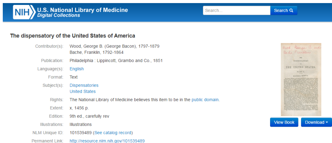
Slika 11. Fotografija primjene Dublin Core sheme metapodataka za opis građe u National Library of Medicine

rječničke termine i slično. Neki od najčešće korištenih elemenata su identifikator, naslov, predmet, izdavač, datum dostupnosti i kreiranja, jezik, prava, veze, format i slično, a otvarajući pojedine zapise mogu se vidjeti dosta detaljni opisi dokumenata. 41