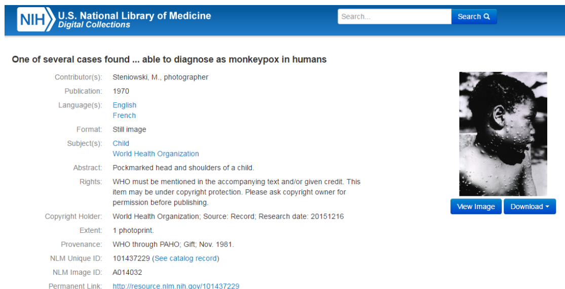
Slika 12. Fotografija primjene Dublin Core sheme metapodataka za opis građe u National Library of Medicine