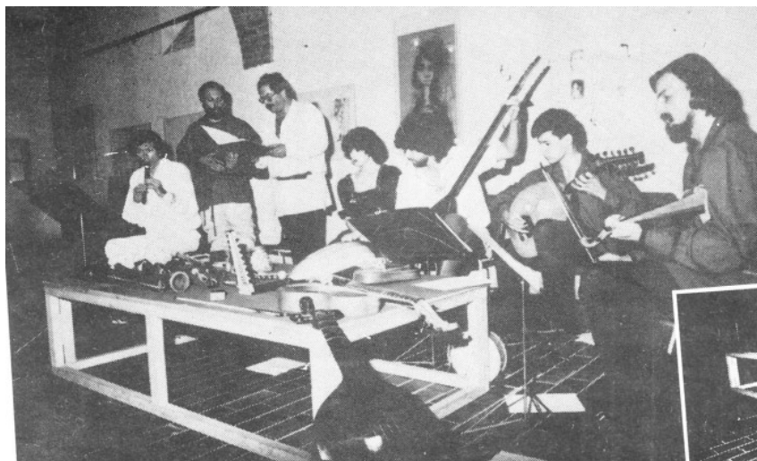
Slika 5 – Koncert grupe Renesans

jedinom sastavu ove vrste u Jugoslaviji novinarka časopisa Ten zamjera što nisu imali vremena za intervju te je njen opis samoga događaja zbog toga ostao vrlo štur. 181