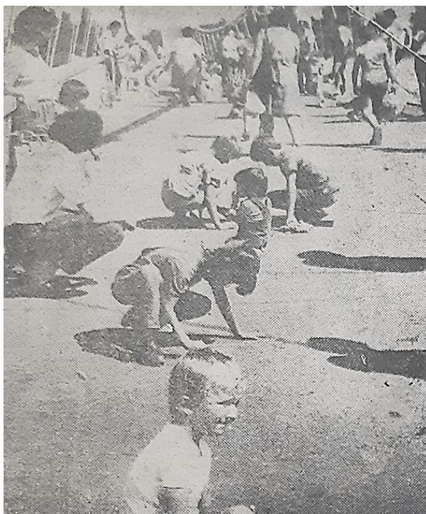
Slika 4 – Akcija „Crtamo na mostu“

Likovni je program bio dostupan i najmlađim Osječanima koji su svoju kreativnost pokazali u akciji „Crtamo na mostu“. Ovakva „galerija pod vedrim nebom“ za najmlađe bila je organizirana i prethodnih godina te je zbog velikog odaziva ponovljena i održana kao manifestacija s najvećim brojem posjetitelja u okviru „Osječkog ljeta mladih '84.“. Mališani su tako oslikali Most mladosti, a njihovu je kreativnost „nakon nekoliko sati uspio zaustaviti tek nedostatak krede“. 152