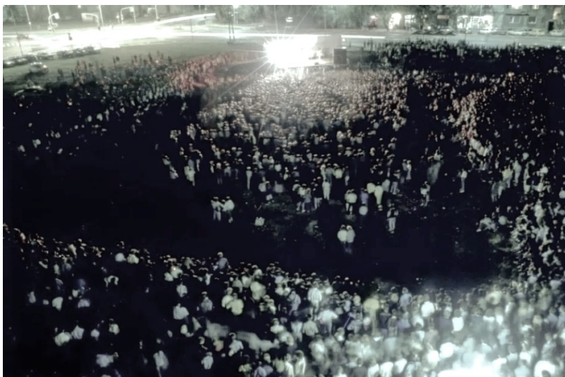
Slika 9 – Publika na koncertu u „Rupi“

rock, akustične i ozbiljne glazbe. U planiranom je troškovniku naznačeno kako je cijena jednog koncerta otprilike bila 500.000 dinara te je ukupni proračun za glazbu iznosio 19.500.000 dinara. 260 Pod parolom „za svakoga po nešto“ našli su se brojni domaći glazbenici, ali i gostujuće skupine, od kojih su neki na OLJM-u nastupili po prvi puta, dok su neki već bili tradicionalni gosti Grada na Dravi. Sezona koncerata otvorena je akcijom „Stari tramvaj“ u kojoj su se gradom čuli zvuci koji pozivaju na cjeloljetni program kojeg je otvorila zagrebačka grupa Azra. Iz Zagreba su još došli i članovi grupa ITD Band, Neki to vole vruće, Psihomodo pop, kao i mlada grupa Dee Dee Mellow koja je donijela drugačiji zvuk modernijeg swinga, nešto bližeg rock zvuku. 261 Osječkoj se publici po prvi puta predstavio i beogradski ansambl Musica antiqua koji su izveli glazbu srednjeg vijeka, rane renesanse i dvorskih zabava, a publika ih je u punoj Galeriji Waldinger nagradila velikim pljeskom. Na nesvakidašnjem se koncertu našla glazba trubadura s dvorskih zabava te vinske i šaljive pjesme s trgova od 9. do 14. stoljeća, i to sve uz zvuke originalnih renesansnih instrumenata. 262 Iz Beograda su još nastupili Piloti i publici uvijek draga Ekatarina Velika, a posljednji veliki glazbeni nastup za ovo je ljeto bio koncert Dejana Cukića i grupe Spori ritam band, koji je u velikom broju pratila mlada i nešto starija publika. 263