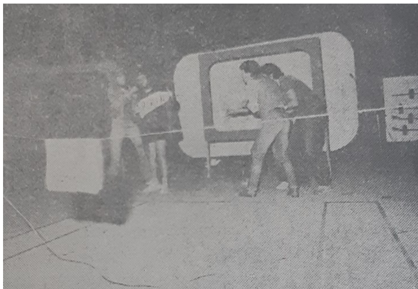
Slika 1 – „Telemanija broj šest“

S po dvije predstave gostovali su još i Kazalište „Lero“ iz Dubrovnika te Dramsko amatersko kazalište „Daska“ iz Siska. Dubrovčani su izveli „Kartoteku“ i predstavu „Partizanska pozornica“, a amateri iz Siska „Vodnika pobjednika“ i „Tri praščića“. Dramski dio programa otvorili su članovi Amaterskog kazališta „Joza Ivakić“ iz Vinkovaca koji su publiku dočekali s predstavom „Satir iliti divlji čovik“. 74