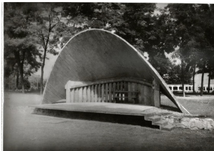
Slika 3 – „Školjka“ pred Domom JNA

no prilično skupe lokacije. Zbog tog su se razloga koristile javne gradske lokacije koje su bile pristupačne i lako dostupne većem broju posjetitelja. „Rupa“ kod STUC-a, kulise Tvrđe, „školjka“ pred Domom JNA, popularno okupljalište mladih pred „Romom“ na početku osječkog korza te Prolaz Franje Krežme samo su neke od lokacija koje su pridonijele živosti cijele akcije. Uz to, dokazale su kako Osijek ima zanimljivih, a prije svega i upotrebljivih, prostora na otvorenome koji se mogu prilagoditi različitim programskim sadržajima. 103