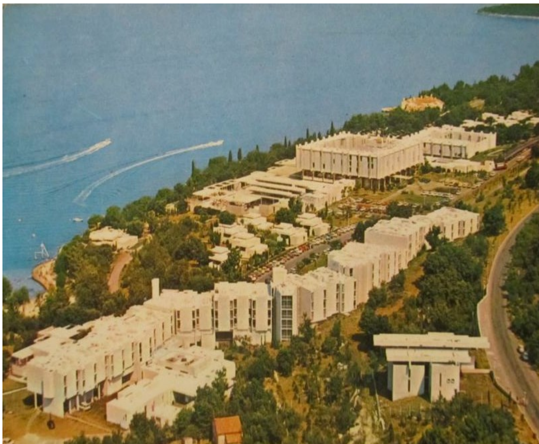
Slika 5. Kompleks Haludovo na otoku Krku u Malinskoj.