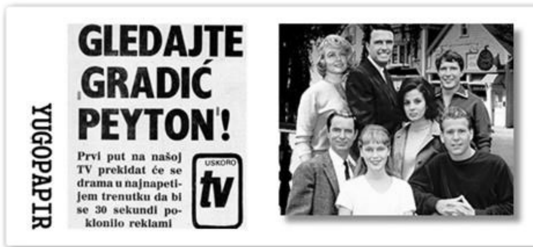
Slika 10. Prikaz oglašavanja američke sapunice Gradić Peyton u Jugoslaviji.

http://www.yugopapir.com/2014/10/fenomen-popularnosti-tv-serije-gradic.html