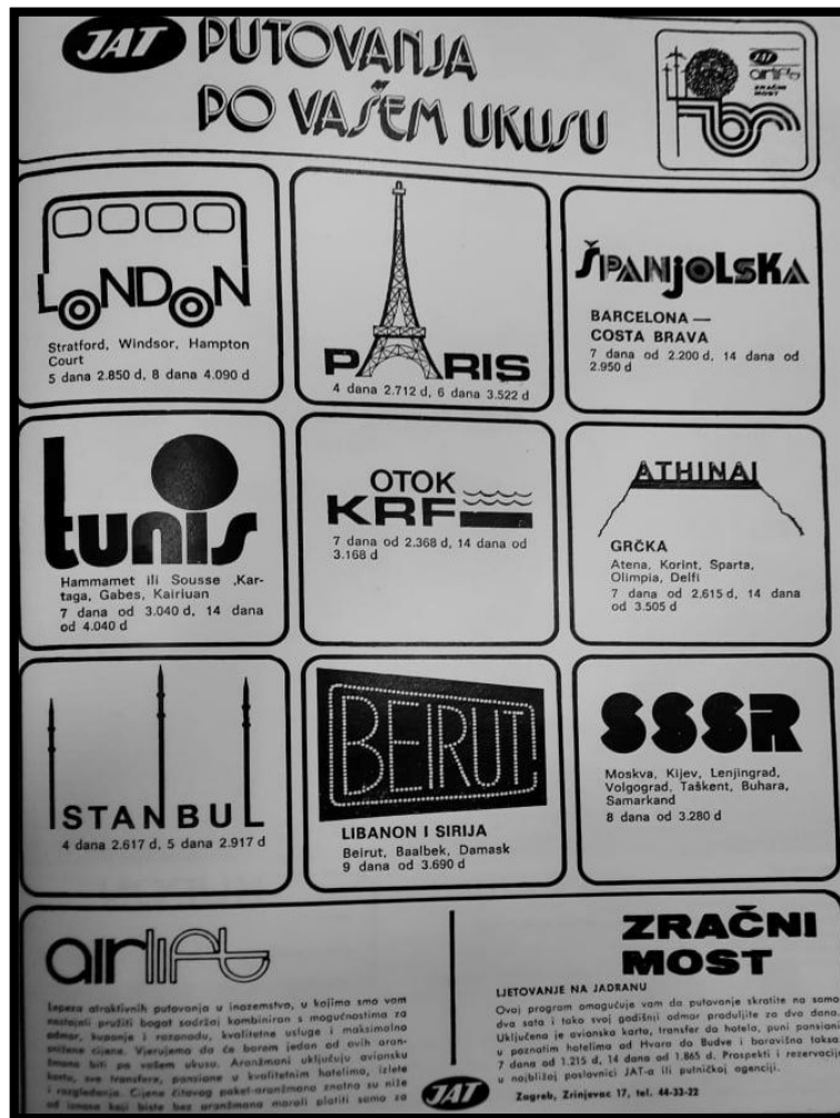
Slika 1. Primjer oglašavanja Turističke agencije JAT u časopisu Turizam .