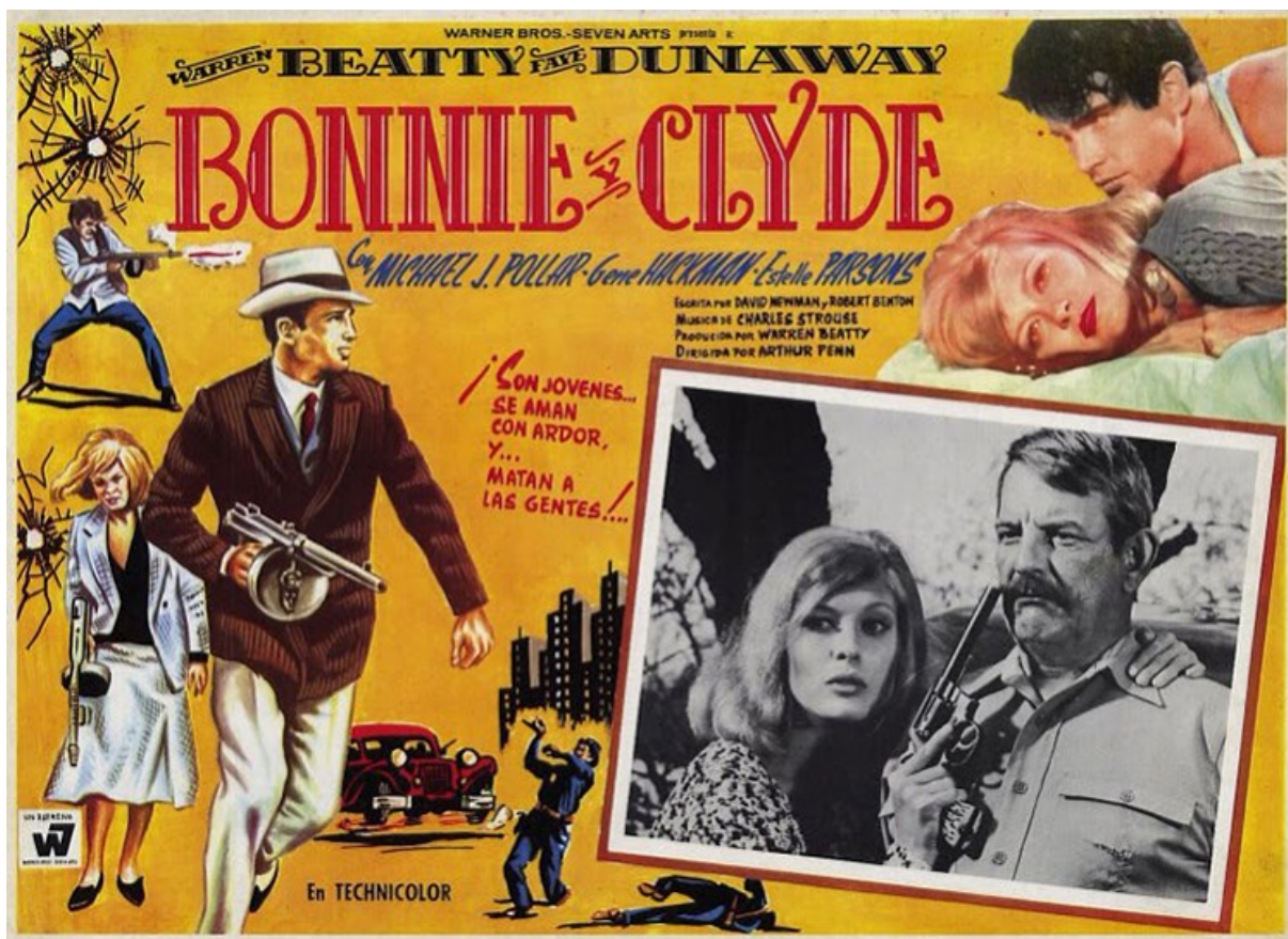
Slika 12. Prikaz postera filma Bonnie and Clyde