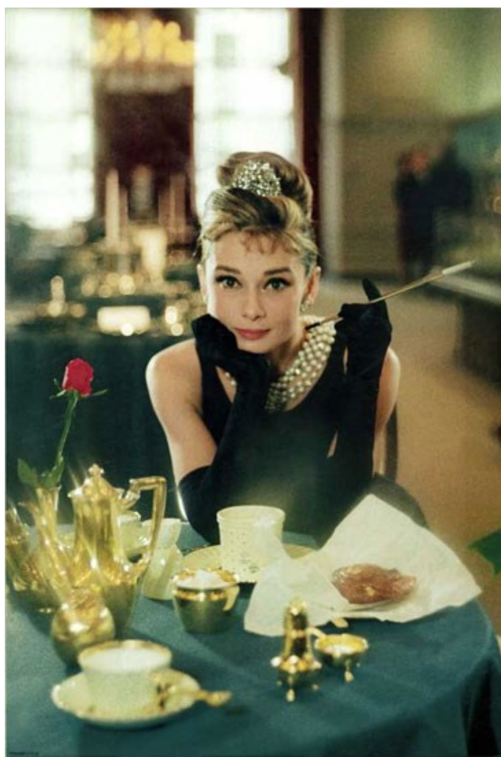
Slika 11. Audrey Hepburn, koja je u kultnom filmu Doručak kod Tiffanyja glumila Holly Golightly.

https://mojtv.hr/film/11348/dorucak-kod-tiffanyja.aspx