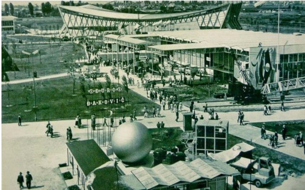
Slika 4. Prvi Zagrebački velesajam održan u Savskoj ulici 1947.

https://povijest.hr/nadanasnjidan/prvi-zagrebacki-velesajam-odrzan-je-u-savskoj-ulici-1947/