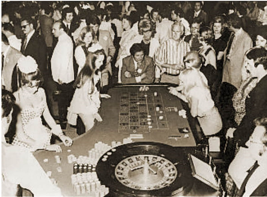
Slika 6. Prikaz kockarnice u turističkom kompleksu Haludovo nalik na one u Las Vegasu.

https://radiosarajevo.ba/magazin/zanimljivosti/uspon-i-pad-najluksuznijeg-hotela-u-sfrj-od-bazena-punjenih-sampanjcem-do-rusevine/338948