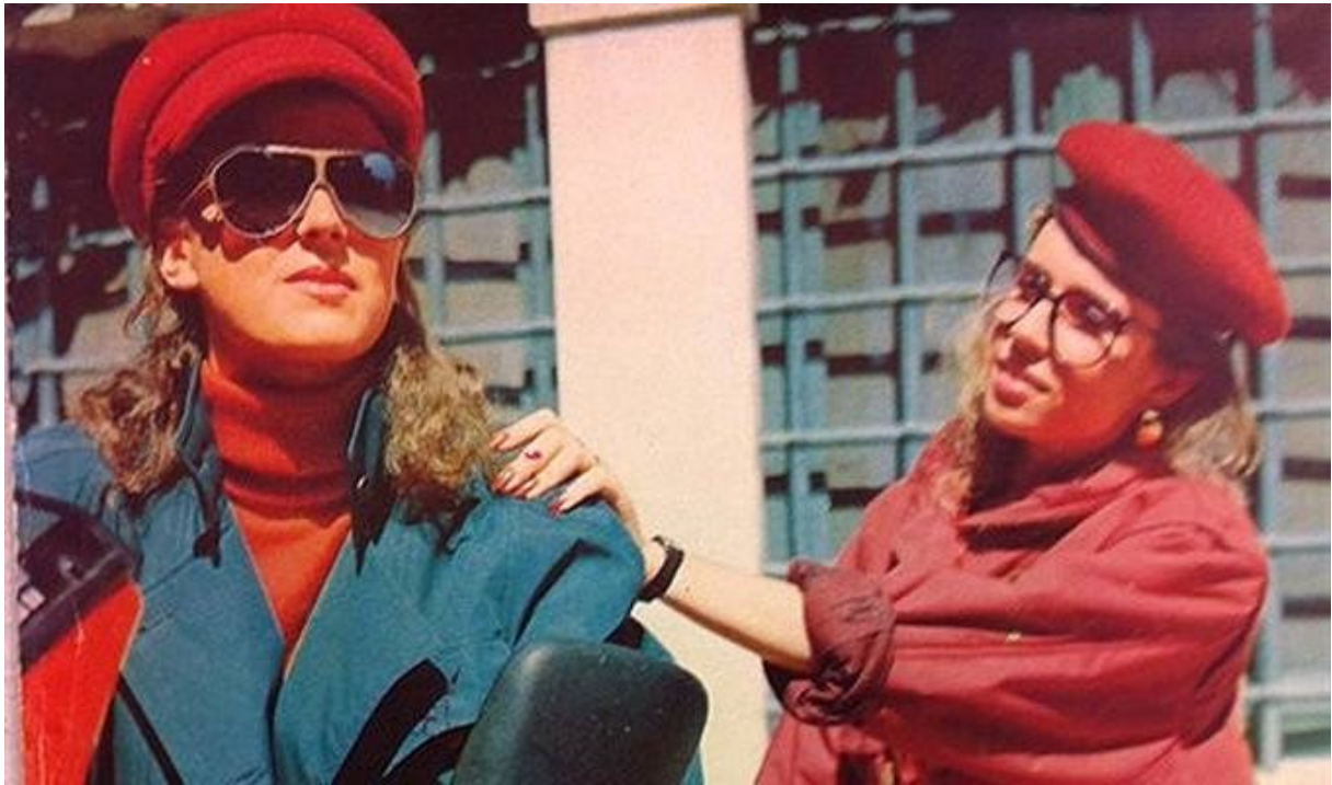
Slika 15. Prikaz hippie naočala, koje su prekrivale gotovo polovinu lica.

http://drukciji.ba/2014/10/28/pogledajte-kako-su-se-odijevale-zene-u-jugoslaviji/