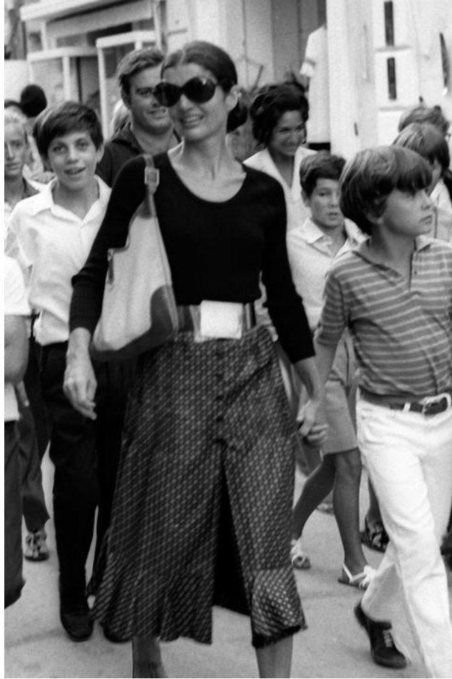
Slika 14. Jacqueline Kennedy, prva dama SAD-a koja je zaokupljala pažnju javnosti te je postala jedan od simbola ženstvenosti svojim minimalističkim stilom.

https://www.townandcountrymag.com/style/fashion-trends/g9947418/10-brands-jackie-kennedy-loved/