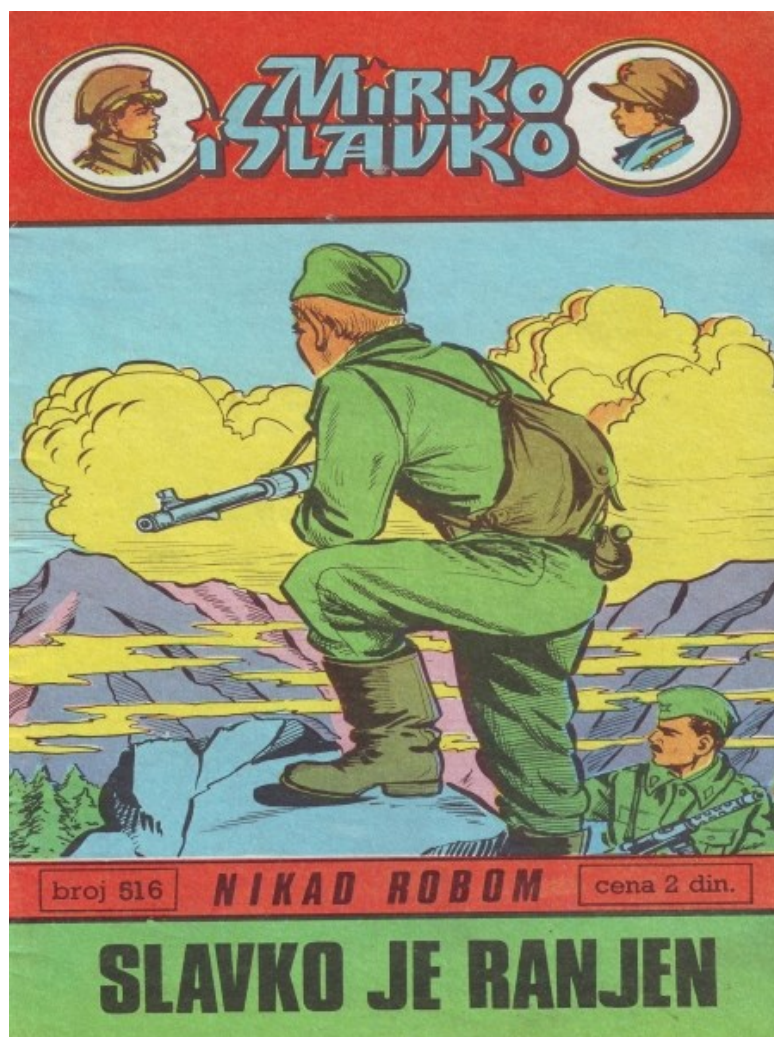
Slika 9. Mirko i Slavko , roman; naslovnica „Nikad robom. Slavko je ranjen.“

http://www.stripovi.com/enciklopedija/strip/mirko-i-slavko-nkrb-516-slavko-je-ranjen/29486/0/