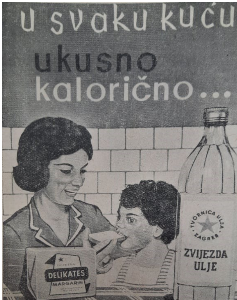
Slika 2. Primjer oglašavanja Zvezdinih proizvoda.

https://inkubatormargarinmajoneza.weebly.com/margarin.html