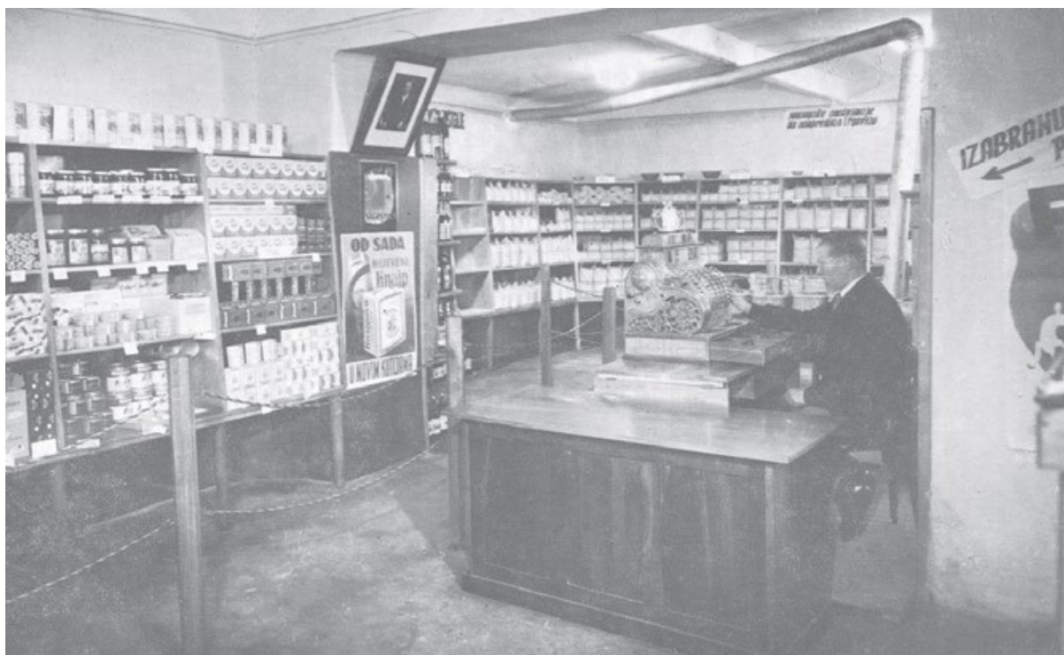
Slika 3. Prikaz unutrašnjosti prve samoposluge otvorene u gradu Ivancu.

https://hrcak.srce.hr/index.php?show=clanak&id_clanak_jezik=258666