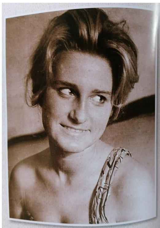
Prilog 2. Mani Gotovac u mladosti.