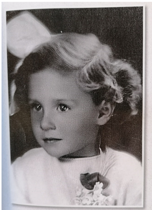
Prilog 1. Mani Gotovac u djetinjstvu.