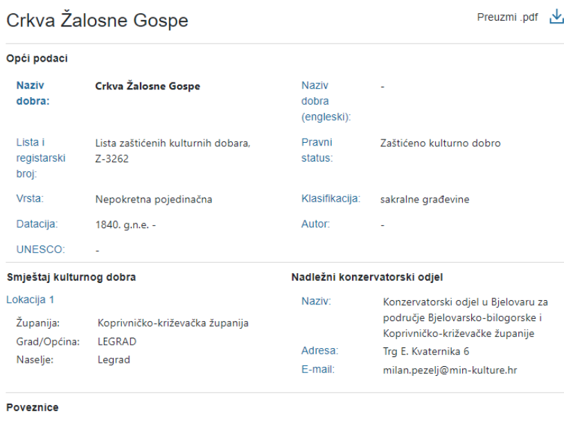
Slika 3. Primjer nepokretnog kulturnog dobra i podataka o njemu. 70

Dakle, napredno pretraživanje podijeljeno je u pet izbornika kojim se kulturna dobra mogu pretraživati po osnovnim podacima, vrsti kulturnog dobra, pravnom statusu, o tome je li dobro na UNESCO-voj listi te prema tome gdje se dobro nalazi odnosno prema smještaju. Trenutno je u online Registar upisano 6379 kulturnih dobara te je sve rezultate moguće preuzeti u Excel-u ili PDF formatu. Kao što je već napisano, svaki rezultat moguće je prikazati te će se klikom na neko dobro prikazati osnovni podaci o njemu. Osnovni podaci o kulturnim dobrima koji su dostupni javnosti prikazani su u primjeru pretrage (Slika 3.) kojom je odabrano nepokretno kulturno dobro pod nazivom Crkva Žalosne Gospe .