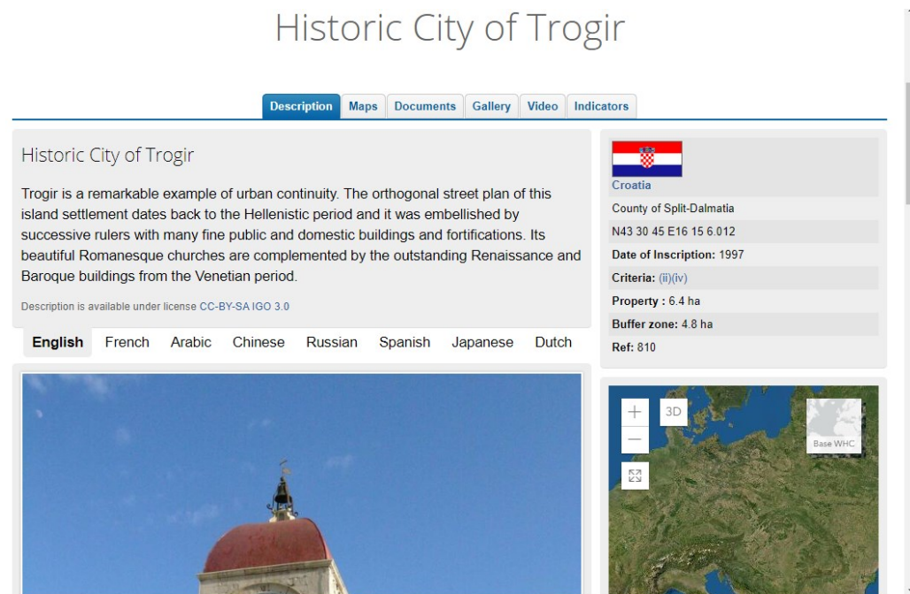
Slika 9. Primjer UNESCO-vog prikaza kulturnog dobra i podataka o njemu. 76

Za razliku od stranice Registra, UNESCO-va stranica ponudila je daleko bolje i detaljnije informacije. UNESCO nudi opis dobra na 8 različitih jezika te druge zanimljivosti kao što su različiti dokumenti, veći broj fotografija, video zapisi, karta s označenom lokacijom i brojne druge informacije. Iako strateškim planom Ministarstvo prati europske trendove i želi poboljšati dostupnost podataka o kulturnim dobrima Republike Hrvatske, uspoređujući podatke na ove dvije stranice možemo reći da je dostupnost podataka u Registru u velikom zaostatku. Podaci o kulturnim dobrima koji se ne nalaze na UNESCO-voj listi teško su dostupna korisnicima izvan Republike Hrvatske, a samim time smanjen je i razvoj novih sadržaja koji je važan za sektor kulture. Kulturološko-društveni značaj ponajviše se može prikazati izgradnjom i pružanjem novih usluga koje jačaju kulturni i društveni razvoj. 77 Najveću ulogu u razvoju takvog društva trebali bi osigurati nadležna tijela za kulturna dobra te informacijske ustanove koje promoviraju i potiču zaštitu kulturnih dobara.