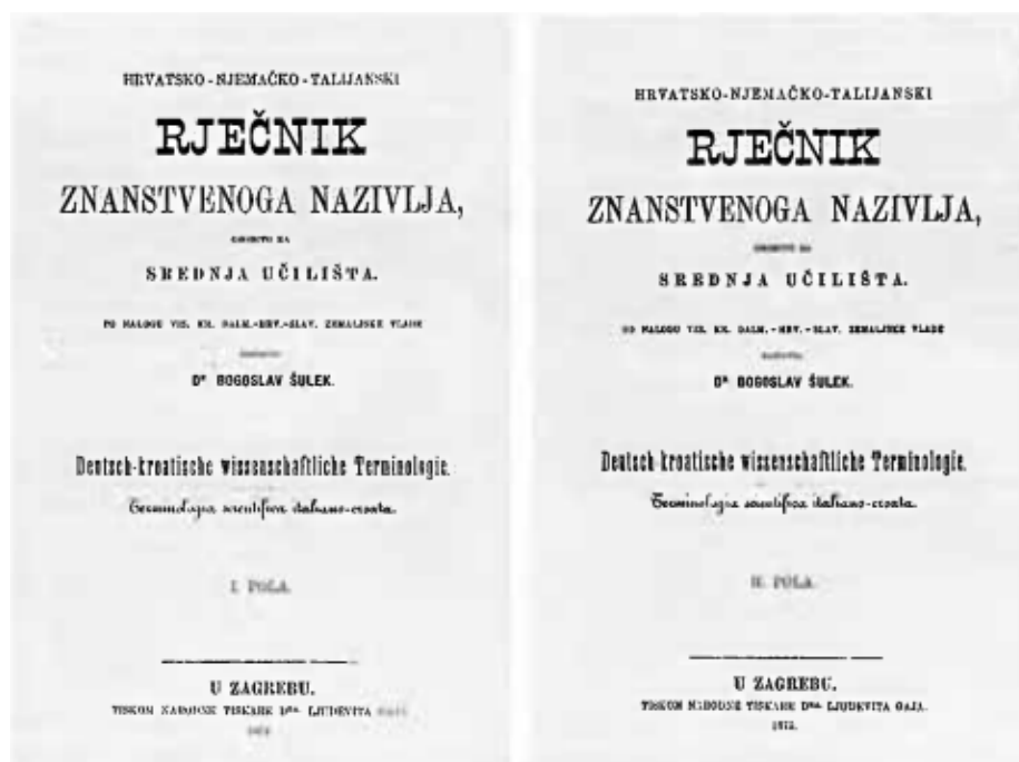
Prikaz 3. Naslovnica prvog i drugog sveska Hrvatsko-njemačko-talijanskog rječnika znanstvenoga nazivlja (Gostl, 1995: 94, 95)

Šulek sam kaže da je na rječniku radio ukupno četiri godine, po osam sati dnevno. Idućih šest godina utrošeno je na pripremanje za tisak i tiskanje. Godine 1847., prvi svezak (A–N) Hrvatsko-njemačko-talijanskoga rječnika znanstvenoga nazivlja konačno je ugledao svjetlo dana. Drugi dio rječnika (O–Ž) izlazi godinu dana kasnije, 1875. Rječnik su sačinjavale 1372 stranice, a iako je trebao biti rezultat kolektivnog rada, Šulek ga s pravom pripisuje sebi (Gostl, 1995: 97).