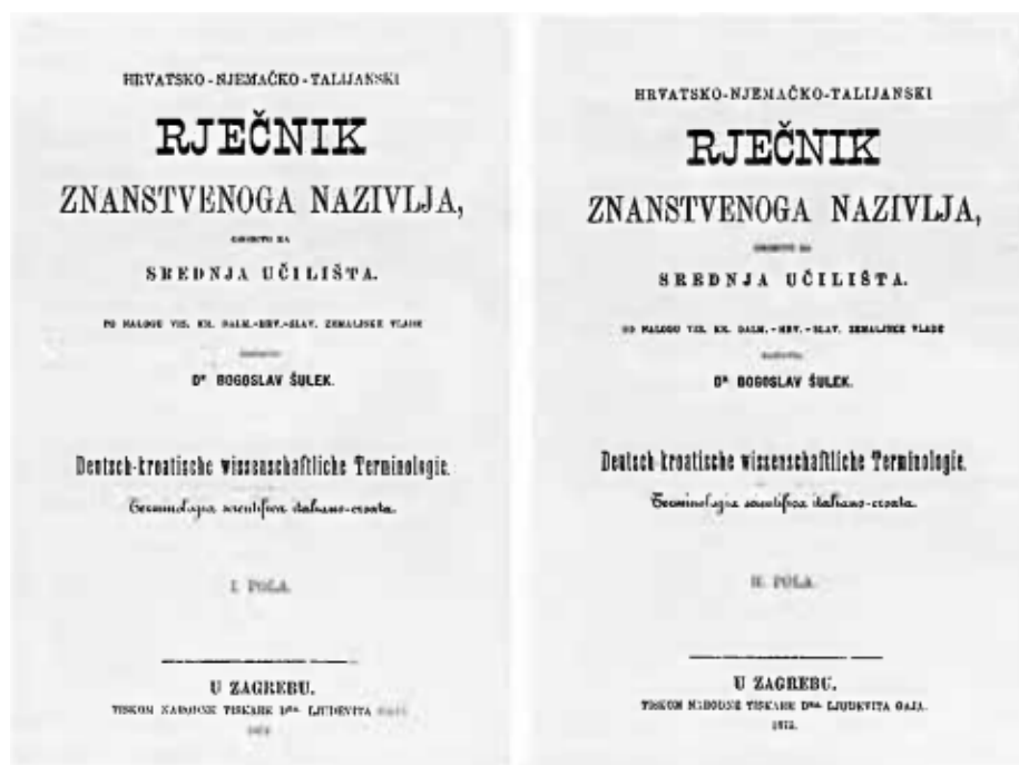
Prikaz 3. Naslovnica prvog i drugog sveska Hrvatsko-njemačko-talijanskog rječnika znanstvenoga nazivlja (Gostl, 1995: 94, 95)

Šulek sam kaže da je na rječniku radio ukupno četiri godine, po osam sati dnevno. Idućih šest godina utrošeno je na pripremanje za tisak i tiskanje. Godine 1847., prvi svezak (A–N) Hrvatsko-njemačko-talijanskoga rječnika znanstvenoga nazivlja konačno je ugledao svjetlo dana. Drugi dio rječnika (O–Ž) izlazi godinu dana kasnije, 1875. Rječnik su sačinjavale 1372 stranice, a iako je trebao biti rezultat kolektivnog rada, Šulek ga s pravom pripisuje sebi (Gostl, 1995: 97).