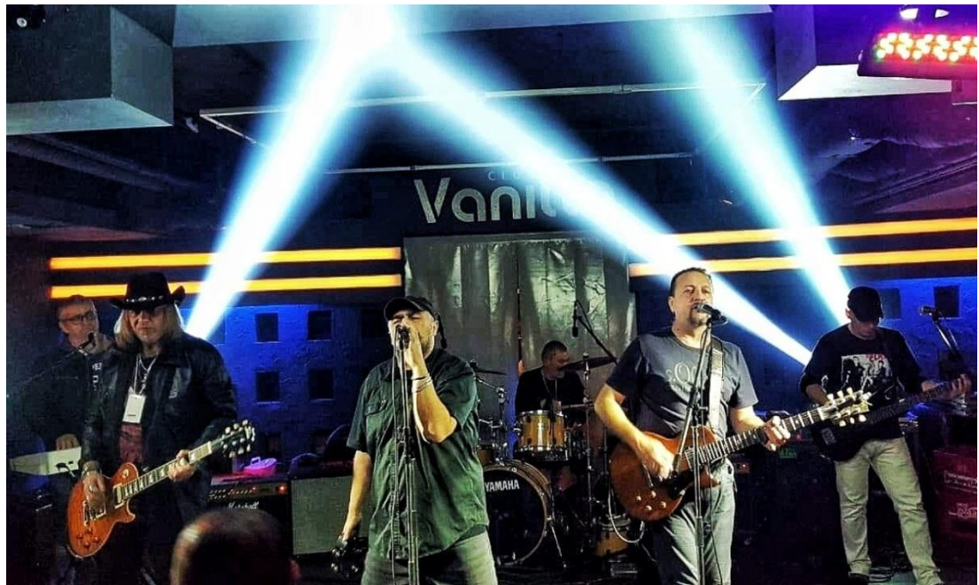
Slika 1. Nastup the Karambola na 11. Rock Marinfestu (2018.)

Također, bili su zastupljeni na albumima Novi zvuk i Najbolje rock pjesme u izdanju Croatia Recordsa. Imali su obostranu suradnju s Daliborom Bartulovićem – Shortyjem u pjesmama Svirepo i brutalno i Ne vjeruj mi . Iza njih su deseci singlova i spotova objavljenih u vrhunskoj produkciji. Odsvirali su mnogo, što većih, što manjih koncerata a, i dalje neumorno sviraju. U nastajanju su i pjesme za drugi album, a neke od njih su: Potpuno siguran , Cesta , Ona nije tu , Vatra , Zadrži dah .