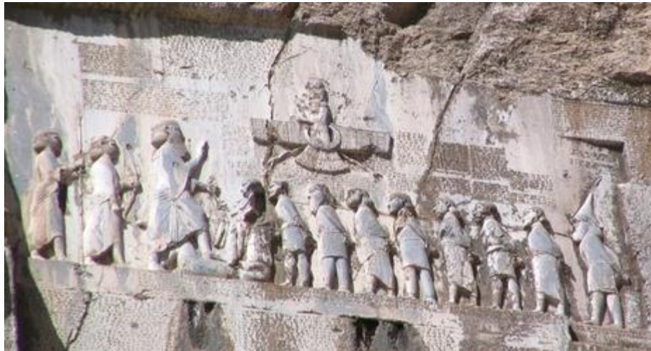
Slika 3. Behistunska stijena - ključ za odgonetavanje klinastog pisma

u Babilonu, Lagašu, Nippuru..., ali su Ninive prvo mjesto u kojima je pronađena cijela knjižnica. 29