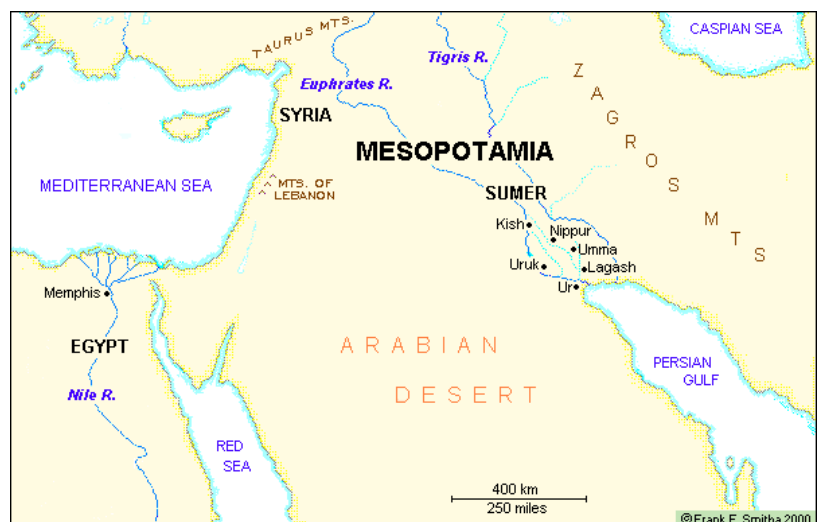
Slika 1. Karta Mezopotamije i Sumera s gradovima: Ur, Uruk, Kiš, Lagaš, Umma i Nippur.