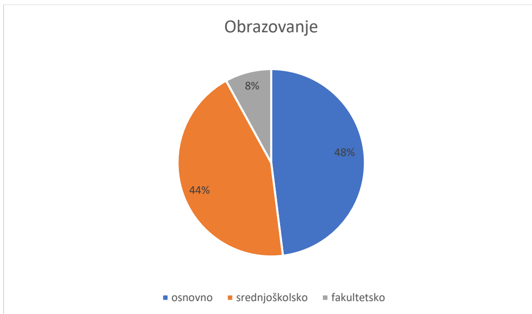
Graf 2. Struktura ispitanika po stupnju obrazovanja