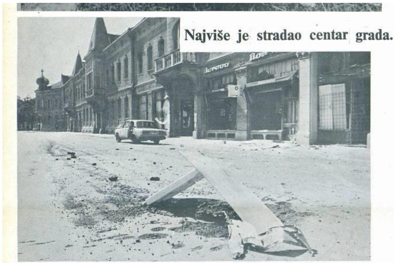
Prilog 1. Rupa od projektila u samom centru grada Vinkovaca, (Vinkovački list, 4.10.1991.)