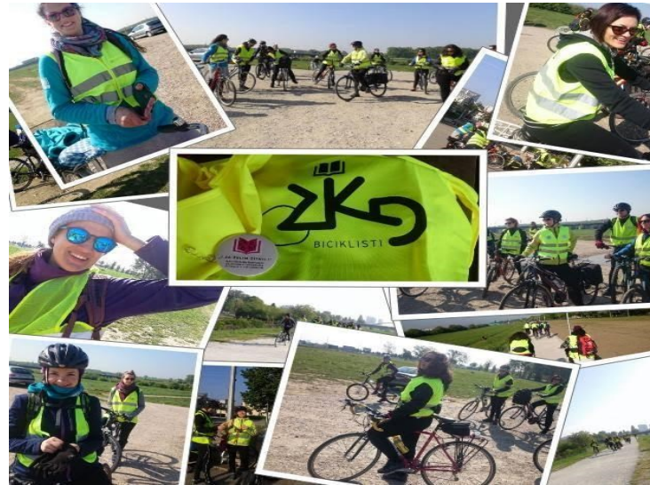
Slika 2. ZKD Biciklisti

projekt s vremenom uspješno proširuje na cijelu Hrvatsku pod nazivom Biciklom kroz knjižnice Hrvatske . 82 Prva biciklijada u sklopu ovog programa, organizirana je 2018. na ruti od Zagreba do Karlovca. 83 ZKD Biciklisti pokušavaju skrenuti pozornost na svoj rad tako što sudjeluju na različitim manifestacijama poput Noći knjige, Dana planeta Zemlja, Zeleni festival – Okrenimo na zeleno, Europski tjedan mobilnosti, Festival znanosti, „Let’s Go Green!“ – 1. međunarodna konferencija o zelenim knjižnicama, itd. 84