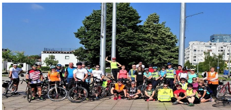
Slika 4. Sudionici kampanje „I ja želim čitati“

organizirala u suradnji s Općinom Peteranec i Udrugom za pomoć osobama s intelektualnim teškoćama Latice . 100 Sudionici ove biciklijade mogli su uživati u kratkom edukativno-glazbenom programu koji je organizirala Udruga štovatelja Frana Galovića "Galovićevo dom" te su posjetili Muzej grada Koprivnice i upoznali se s djelima akademskog kipara Ivana Sabolića. 101 Biciklom od Koprivničke knjižnice do Koprivničkog Ivanca , naziv je druge biciklijade koju je organizirala ova knjižnica 2019. godine u suradnji s Općinom Koprivnički Ivanec , Udrugom za pomoć osobama s intelektualnim teškoćama Latice , Muzejom grada Koprivnice i Biciklističkim klubom "Rotor" . 102 Akcija je i ove godine održana u znak potpore kampanji za osobe s teškoćama u čitanju i disleksijom "I ja želim čitati" te su sudionici imali priliku upoznati se s lokalnom kulturnom baštinom pod nazivom "Ivanečki vez".