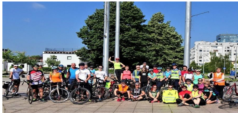
Slika 4. Sudionici kampanje „I ja želim čitati“

organizirala u suradnji s Općinom Peteranec i Udrugom za pomoć osobama s intelektualnim teškoćama Latice . 100 Sudionici ove biciklijade mogli su uživati u kratkom edukativno-glazbenom programu koji je organizirala Udruga štovatelja Frana Galovića "Galovićevo dom" te su posjetili Muzej grada Koprivnice i upoznali se s djelima akademskog kipara Ivana Sabolića. 101 Biciklom od Koprivničke knjižnice do Koprivničkog Ivanca , naziv je druge biciklijade koju je organizirala ova knjižnica 2019. godine u suradnji s Općinom Koprivnički Ivanec , Udrugom za pomoć osobama s intelektualnim teškoćama Latice , Muzejom grada Koprivnice i Biciklističkim klubom "Rotor" . 102 Akcija je i ove godine održana u znak potpore kampanji za osobe s teškoćama u čitanju i disleksijom "I ja želim čitati" te su sudionici imali priliku upoznati se s lokalnom kulturnom baštinom pod nazivom "Ivanečki vez".