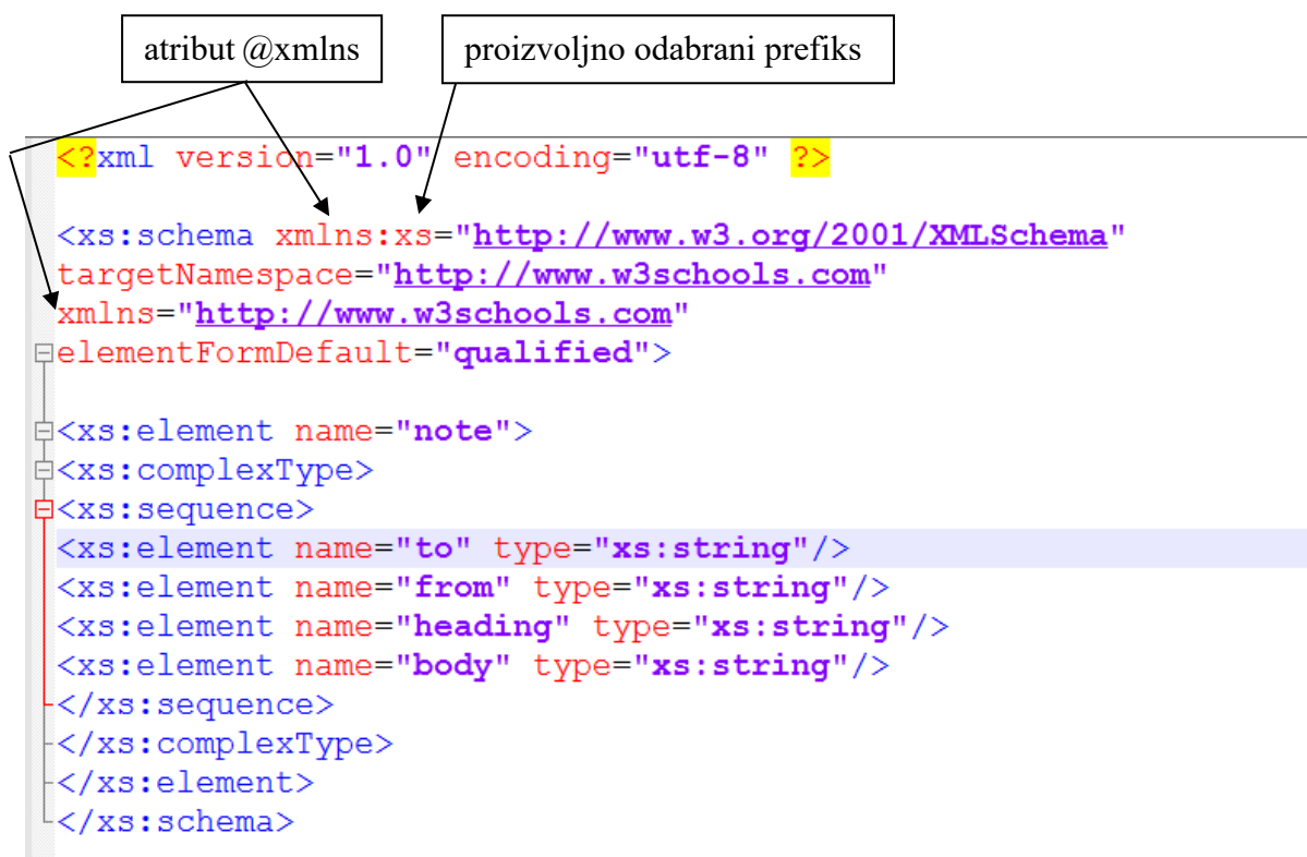
Slika 5. - Primjer XML Schema dokumenta.

omogućuje i definiranje vlastitog tipa podataka. Najvećom prednošću smatramo podršku za XML imenske prostore koja je navedena i u preporuci specifikacije W3C XML Scheme. Imenski prostori koriste se za grupiranje elemenata i atributa koji su povezani na specifičan način. Uobičajeno, imenski prostori identificiraju se jedinstvenim URI-jem (engl. Uniform Resource Identifier ). Imenski prostor se navodi u korijenskom elementu XML dokumenta kao vrijednost atributa @xmlns . Pritom, atributu @xmlns pridodan je prefiks koji zatim rabe i svi elementi deklariranog imenskog prostora u XML dokumentu. Ovdje je važno naglasiti da se imenski prostor ne mora odnositi na neku stvarnu URL adresu, već da zadovolji funkciju jedinstvenog identifikatora.