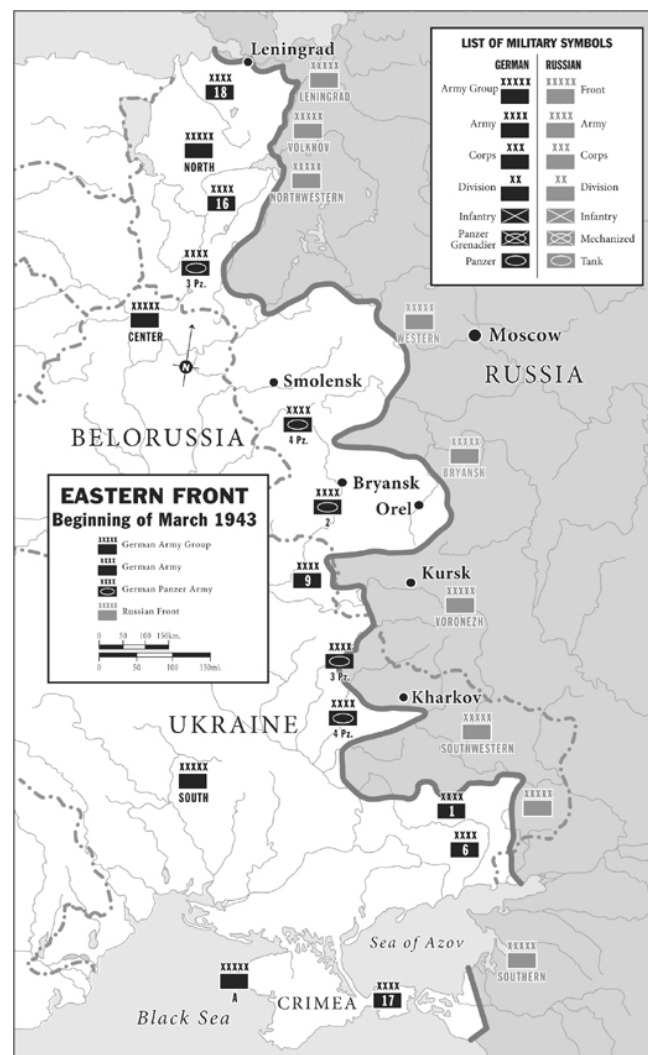
Slika 1: Stanje na istočnom frontu do 1943. godine.

očekivao napad na jugu u dijelu Kavkaza. Njemačke snage ponovno su brzo napredovale, ali ovaj put zbog manjka sovjetskih vojnika u tim dijelovima države. Hitler je sada kao cilj imao Staljingrad – simbolični centar države. Nadao se brzom pobjedi nad sovjetskom vojskom kako bi mogao ponovno većinu svojih snaga prebaciti prema Moskvi. Unatoč pomnom planiranju, Hitler je ponovno podcijenio Sovjete; bitka za Staljingrad trajala je predugo i iscrpila je njemačku vojsku više nego što je itko predvidio stoga je Hitler bio primoran na povlačenje vojske. 6