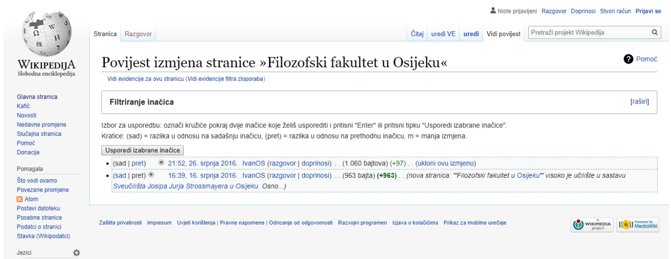
Slika 1. Pregled povijesti izmjena odabrane teme na Wikipediji 13

Većina popularnijih članaka na Wikipediji ima sljedeće složenu povijest promjena i revizija mnogih urednika koji su u većini slučajeva dostupni na vrhu stranice članka u Wikipediji (npr. "Povijest" i "rasprava"). Nadalje, na taj način se doći do podataka o korisnicima (na stranicama "korisnika"). Povijest članka je dostupno standardnim wiki sučeljima, dok je za dobivanje istih potrebno mnogo koraka koji omogućuju opći smisao povijesti članka i urednika. Korisničke procjene vjerodostojnosti mogu se poboljšati boljom podrškom za postizanje smisla za uređivanje i članak povijesti, a uključuju WikiScanner, WikiRage i History Flow sustave.