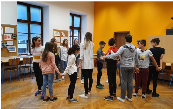
Slika 26. Otpetljavanje čvora s 5. razredom

Prva aktivnost (“Čvor,,) bila je aktivnost otpetljavanja čvora. Svi smo stali jedni kraj drugih, zažmirili te se uhvatili za ruke. Tako smo dobili čvor koji smo trebali otpetljati. Objašnjavanje pravila aktivnosti zahtijevalo je određeno vrijeme. Dok su učenici žmirili, ja sam ih ispravila te spojila dlanove na pravilan način. Kada smo se krenuli otpetljivati, dobili smo dva kruga. Učenike sam na kraju aktivnosti pitala je li im bilo zanimljivo na što su oni potvrdno odgovorili.