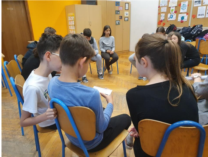
Slika 11. Učenci u grupama rješavaju problemske zadatke

Tijekom predstavljanja svog problema učenici su ukratko objasnili o čemu se radilo u priči te predložili svoja rješenja. Ozbiljno su shvatili svoj zadatak, slušali su jedni druge te ponudili odlična rješenja. Neka od njihovih rješenja uključivala su i odrasle osobe poput nastavnika. Važno je da učenici vide nastavnike kao osobe koje im mogu pomoći ukoliko postoji problem te da se neće ustručavati obratiti nastavnicima za pomoć. Jedna učenica lijepo je predstavila što je bio problem u priči gdje se jedan dječak hvalio drugome i zanemario njegov problem: “Oni su mogli riješiti problem tako da je Karlo mogao poslušati Leonov problem i mogao mu je dati neki savjet, a onda je poslije mogao pričati o svojim uspjesima jer postoji velika razlika između hvaljenja i pričanja o svojim uspjesima, ali da mi poslušamo drugoga a ne da samo pričamo o sebi i ne slušamo drugoga,,