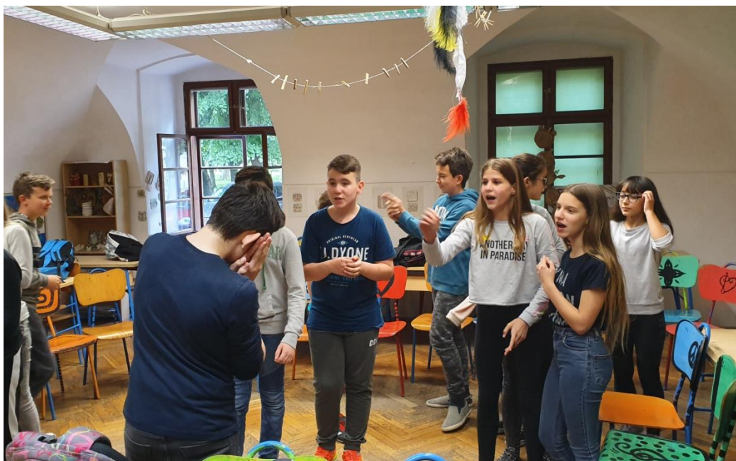
Slika 13. Učenici pogađaju pojmove u timovima

U drugoj aktivnosti (“Verbalna i neverbalna komunikacija,,), učenici su u parovima izvršavali dobivene zadatke, kao i učenici 5. razreda. S obzirom da je jedna učenica bila bez para, kritička prijateljica Arijana sudjelovala je u ovoj aktivnosti. Tijekom razgovora o ostvarenoj aktivnosti, učenici koji su morali ignorirati svog para izjasnili su se kako su se osjećali “ loše jer mi je papirić rekao da to radim a ja to nisam htio raditi,, ; “ dosadno, on tu priča a ja ga moram ignorirati,, . Njihovi parovi, koji su bili ignorirani dok su govorili, osjećali su se “ dobro jer sam znao da me mora ignorirati,, ; “ meni nije bilo bitno jer moj problem nije bio baš važan,, . Ipak, najbolje su se osjećali kada su trebali slušati i ohrabrivati osobu. Kada sam zamolila učenike da dignu ruku ako misle da je da je ovaj drugi, pozitivniji način komuniciranja najčešći za njihov razred, samo je nekoliko učenika diglo ruku, a nekoliko je bilo neodlučnih.