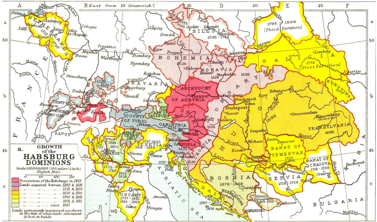
Karta I. Povijesni razvoj Habsburške Monarhije