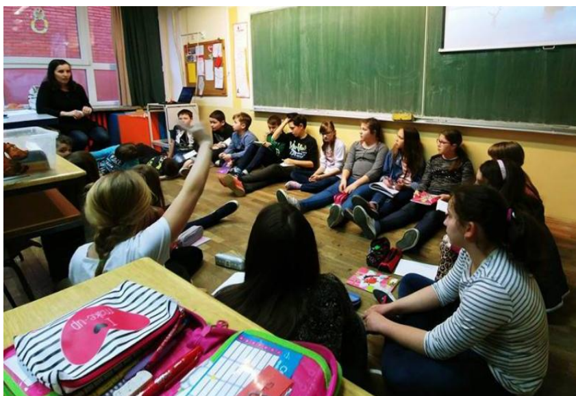
Prilog 10. Fotografija: promjena kraja lektire