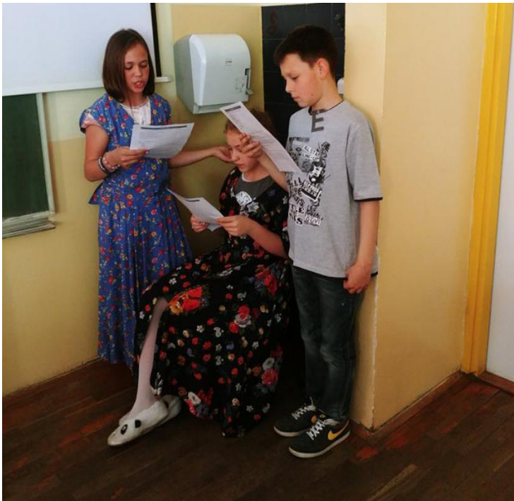
Prilog 12. Fotografija: igra uloga

Gđa. Tischbein: Sve ti je na krevetu. Pripazi kad budeš navlačio čarape. Prvo se dobro operi. I uzmi nove uzice za cipele. Idi sad.