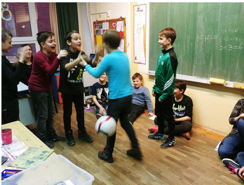
Prilog 9. Fotografija: razgovor o diskriminaciji