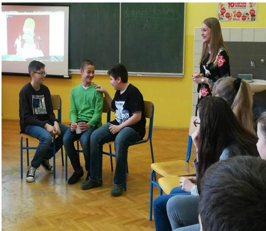
Prilog 6: priča Dječak i pas