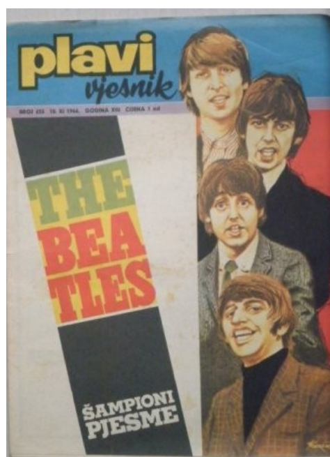
Slika 1. Plavi Vjesnik