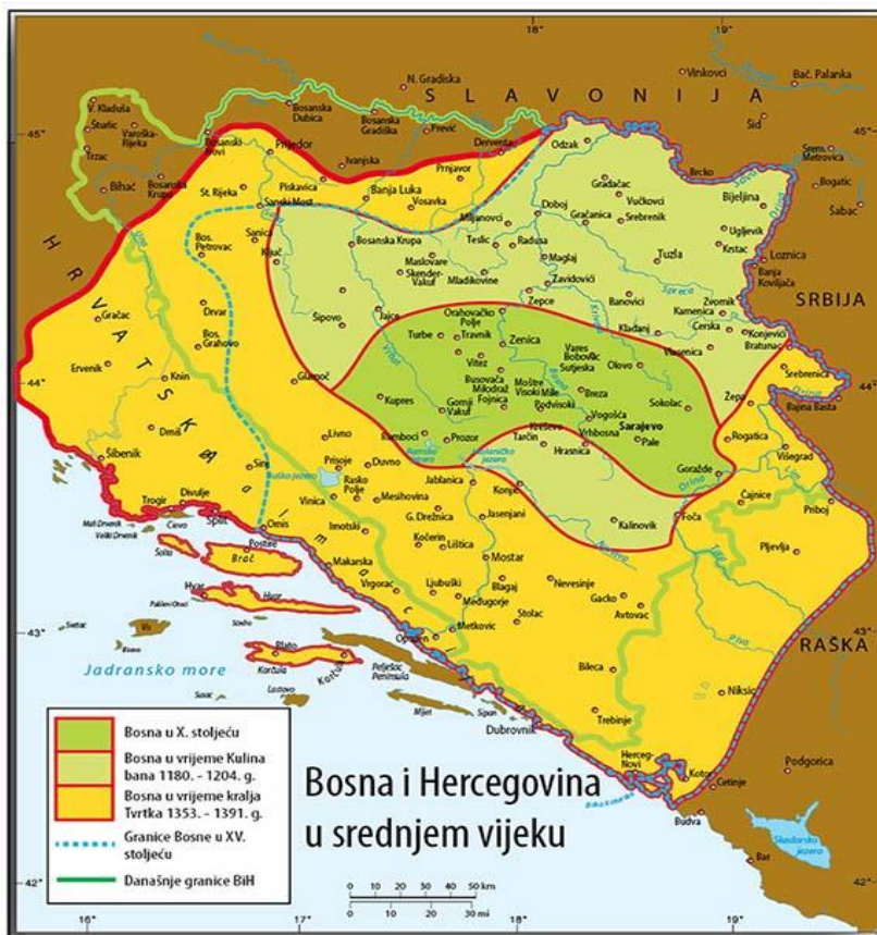
Slika 1: Granice Bosne i Hercegovine kroz povijest