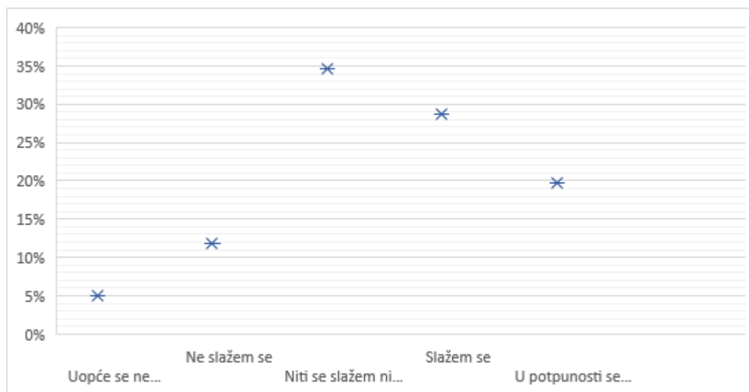
Grafički prikaz 7. Tvrđnja: Baze podataka prilično su jednostavne za pretraživanje te s lakoćom pronalazim tražene informacije

podataka prilično jednostavne za pretraživanje te da se s lakoćom mogu pronaći tražene informacije. Zanimljiv podatak je da se čak 34.7% studenata nije moglo odlučiti smatra li tvrdnju točnom ili netočnom što se može pripisati činjenici da dugotrajnost i uspješnost pretraživanja ovise i o ozbiljnosti i zahtjevnosti rada zbog kojega se vrši pretraživanje. Dok se skoro polovina studenata (48.5%) složila s tvrdnjom, 16.9% ne smatra baze podataka jednostavnima za pretraživanje što može ovisiti i o godini studija studenata koji su odgovorili ovako s obzirom da još nisu stekli iskustvo u pretraživanju istih. Odgovori studenata na ovu tvrdnju vidljivi su u Grafičkom prikazu 7.