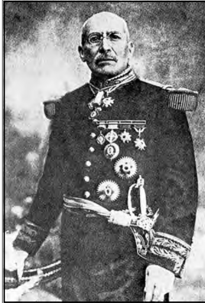
Victoriano Huerta (1850.-1916.)