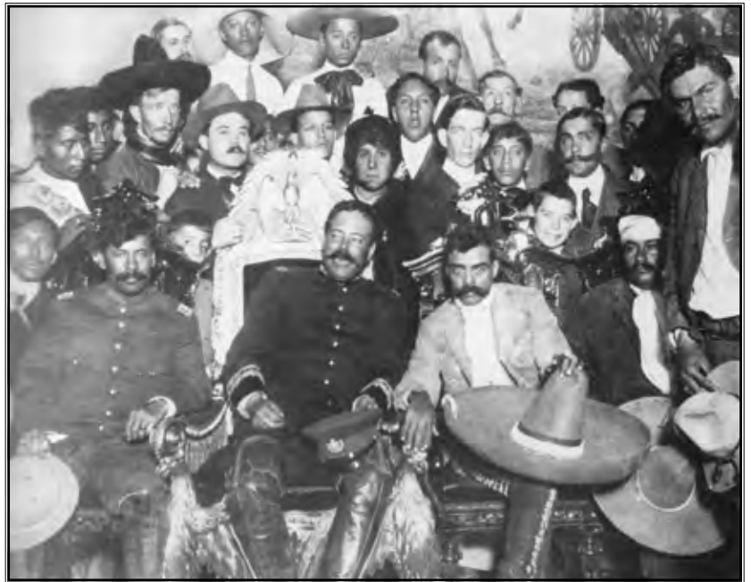
Emiliano Zapata i njegovi sljedbenici.

Pristaše Diazova režima mogu se podijeliti u četiri skupine: vojsku, kler, strane špekulante i veleposjednike. Oni su imali gotovo potpunu slobodu u iskorištavanju prirodnih bogatstava države kao i u podvrgavanju naroda svojim potrebama. Davanjem koncesija stranim investitorima, Diaz je punio blagajnu sredstvima potrebnim za očuvanje svog reži-