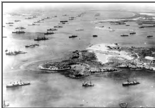
Američke vojne snage kod Veracruza

ce. Meksiko je pao u ruke pobunjenika. (Ogorec, 2011: 303)