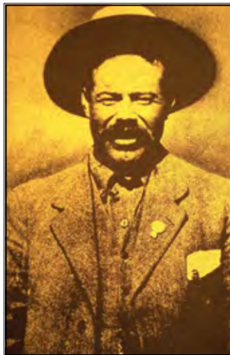
Pancho Villa (1878.-1923.)

U siječnju 1915. Carranza se proglasio predsjednikom Meksika. Dekretom je konfiscirao veleposjede, koje su seljaci mogli dobiti natrag u vlasništvo ako su mogli dokazati da su im posjedi pripadali, ili su mogli zatražiti posjede u zajam. Dekretima je Carranza poboljšao položaj radnika te tako zadobio njihovu potporu, a obećao je i poboljšanje položaja seljaka bezemljaša – peona . (Kos – Stanišić, 2009: 120)