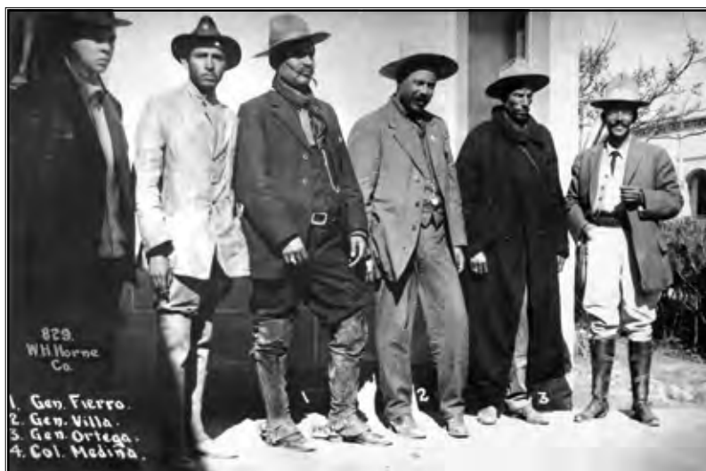
Pancho Villa i revolucionari

Madero je pokušao voditi politiku kompromisa, no to se pokazalo vrlo neuspješnim. Ljevica je imala teško izvedive želje o temeljitoj socijalnoj reformi, a desnica se odupirala gotovo svim Maderovim reformama. Bilo je nemoguće zadovoljiti sve strane, no Madero je, kao idealist, baš to pokušavao te time pokazao da ipak nije bio pravi političar za to krizno vrijeme jer je odbijao vidjeti probleme. (Goldfrank, 1979: 145)