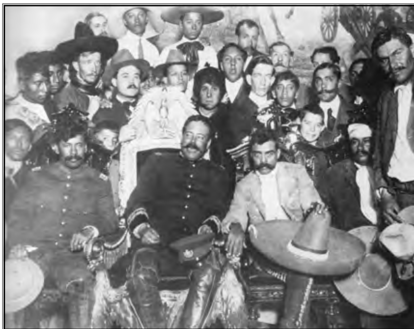
Emiliano Zapata i njegovi sljedbenici.

Pristaše Diazova režima mogu se podijeliti u četiri skupine: vojsku, kler, strane špekulante i veleposjednike. Oni su imali gotovo potpunu slobodu u iskorištavanju prirodnih bogatstava države kao i u podvrgavanju naroda svojim potrebama. Davanjem koncesija stranim investitorima, Diaz je punio blagajnu sredstvima potrebnim za očuvanje svog reži-