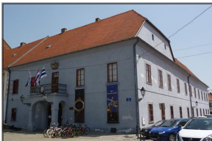
Zgrada Velike gimnazije od 1765. godine (danas Muzej Slavonije)