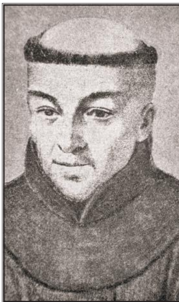
Matija Petar Katančić

do 1914. godine, maturiralo je 477 učenika, prosječno 12 po godini s tim da je do 90-ih godina 19. stoljeća broj učenika po godini bio uglavnom manji od 5, a nakon toga raste i doseže svoj vrhunac 1902. godine, kada je maturiralo 34 učenika. Ako bi se zbrajali maturanti obaju gimnazija, najviše učenika je maturiralo 1905. godine, njih 65. (Pregled razvoja osječkih gimnazija od 1729. do 2000 godine, 2001: 46-49) Kada bi se gimnazijalcima pribrojali i maturanti strukovnih i ostalih srednjih škola, dolazimo do brojke od nekoliko tisuća obrazovanih ljudi, što je svakako bio temelj za društveni, ekonomski i kulturni razvitak.