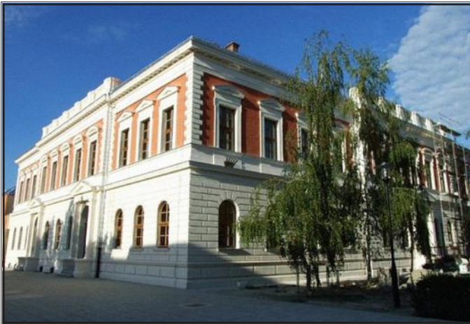
Zgrada Kraljevske muške učiteljske škole (danas OŠ Jagode Truhelke)

Učenici su u toj školi dobivali solidnu opću i stručnu naobrazbu, a uz nastavu i praktični rad velika se pozornost posvećivala i ekskurzijama.