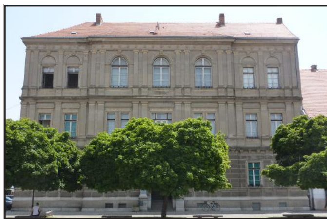
Zgrada Velike gimnazije od 1882. godine (danas Ekonomska i upravna škola)