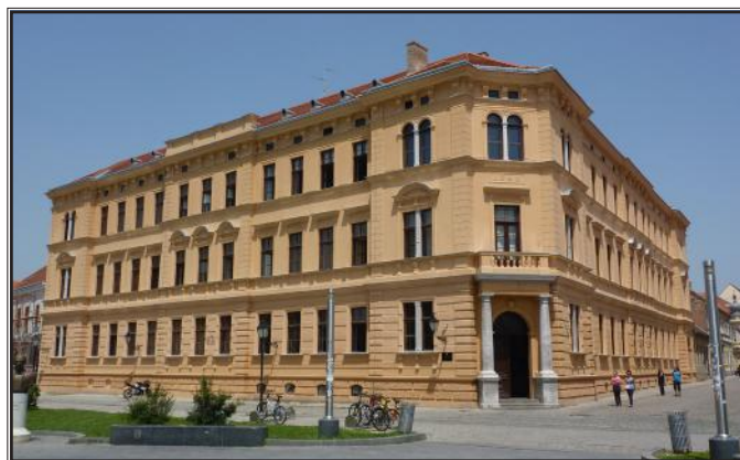
Zgrada Realne gimnazije (danas III: gimnazija)