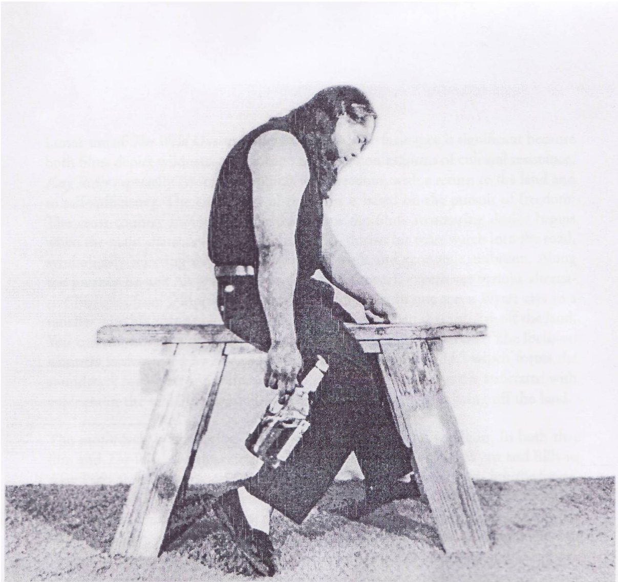
Figure 2: James Luna: The End of the Frail – 1990/91. (Luna, 2001:26)

Odbivši biti dijelom tog popularnog dekora, u svojoj instalaciji ironično nazvanoj Kraj slabašnoga , Luna se satirički našalio s Fraserovim djelom, oponašajući stav njegova iscrpljenog ratnika. No, umjesto konja, Luna jaše "jarca" za piljenje drva i drži bocu alkoholnog pića u ruci umjesto koplja. U suvremenoj odjeći, hineći beživotnost i umor, Indijanac dvadeset prvog stoljeća ne samo što afirmira svoju živuću prisutnost ovdje i sada već se i ruga mitu koji ga zamrzava u slike i rezbarije prošlosti. Stotinu godina kasnije "izumirući divljak" očigledno još nije nestao. On je još uvijek tu i iskače iz kolonijalnog okvira u zbilju sadašnjosti, narušavajući imaginaciju koja ga već stoljećima