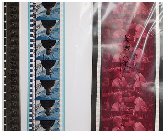
Slika 3. Usporedba formata filmskih negativa (16 mm, 35 mm i 70 mm)

Zaštita “malih“ formata najčešće se provodi povećavanjem i kopiranjem: „Zaštita filmskog gradiva na formatu 9,5 i 8 mm, budući da je riječ o preobratnim 35 kopijama filmova, najsigurnije je presnimiti spomenutim postupkom povećanja na 16 mm ili 35 mm vrpca i to na način da se izrađuju novi dublnegativi i kopije“ 36 Zahvaljujući tome što su bili dugo čuvani u obiteljskim zbirkama i malo projicirani, mnogi od filmova na formatima 8 i 9,5 mm su ostali u prilično dobrom stanju unatoč nesavršenim uvjetima kućnog “skladištenja“, strpljivo čekajući da budu ponovno otkriveni i oživljeni. Iako se presnimavanje na 16 mm vrpca navodi kao najbrži način zaštite ugroženog gradiva, zbog skupoće i složenosti ovog postupka filmski arhivi se češće odlučuju za presnimavanje amaterskih (neprofesionalnih) filmova na digitalne formate: DVD za primjenu, a za dugotrajnu pohranu na ostale formate (tvrđi disk, digitalna beta - posebna magnetna videovrpca za profesionalno snimanje elektronskom tehnikom). Tako će se sačuvati do pojave nekoga novog digitalnog formata. 37