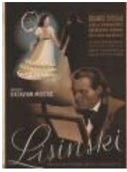
O. Miletić: Lisinski, 1944.

Izbor filmskih plakata domaćih filmova iz zbirke Hrvatske kinoteke: