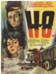
N. Tanhofer: H8..., 1958.