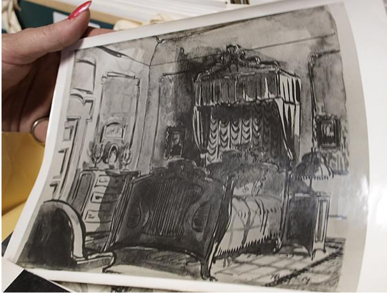
Slika 7. Primjer ručno slikane scenografije za film