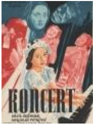
B. Belan: Koncert, 1954.