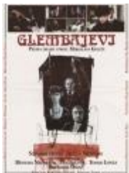
A. Vrdoljak: Glembajevi, 1988.