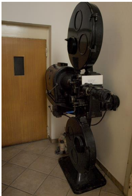
Slika 12. Filmski projektor Bauer