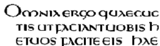
Slika 1. Latinička uncijala

„Pismo koje je slijedilo majuskulni ustroj utemeljen u kapitali i koje svjedoči blago razvijen četverolinijski ustroj (izbacivanjem „slabih“ dijelova iznad i ispod osnovnih dviju redakčnih linija), osobito potaknut sve masovnijim prepisivanjem biblijske književnosti, i to ponajprije za novu knjišku formu – kodeks (sastavljenu od pergamentnih araka), bila je uncijala.“ 4 Ta se latinica oblikovala još u rimsko carsko doba, a afirmirala se tek s prepisivanjem kršćanskih tekstova i njome se intenzivno pisalo sve do 9. stoljeća. Bliža je brzom pisanju nego kapitala, ističe se debelim crtama i oblim formama jer okruglo pismo bolje pristaje kad se piše perom. Zato uncijala postaje pismo kodeksa, dok kapitala ostaje za natpise. Nakon pet stoljeća dominacije, njezini se oblici mogu prepoznati i u mlađim kodeksima u naslovima. U načelu vrijedi pravilo: što je tekst mlađi i slova su oblicima manja, rjeđe se zamjećuje probijanje osnovnih linija, a broj kraćenja i ligatura u starijim je tekstovima mali. Tim tipom latiničnog pisma pisan je Čedadski evanđelistar iz 5./6. stoljeća.