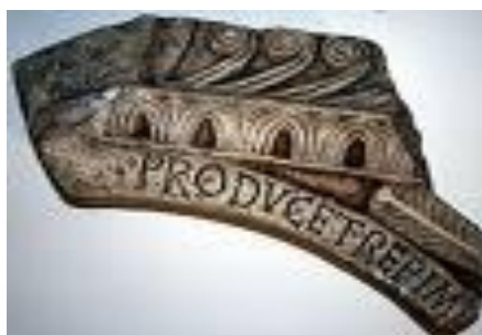
Slika 4. Trpimirov natpis

Mnogi su filolozi iznosili čvrste pretpostavke kako se i pri kristijanizaciji Hrvata zasigurno njihov jezik zapisivao latinskim slovima, barem osnovna liturgijska štiva. U korpusu