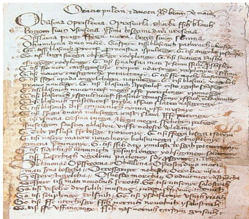
Slika 6. Šibenska molitva

u grafemskom smislu trpjela veći stupanj slobode. Prema nekim jezičnim pogreškama uočljivim u tekstu može se zaključiti da pisar nije dobro poznao hrvatski jezik, ali otkako je otkriveno da je Šibensku molitvu zapisao fra Pavao Šibenčanin te se pogreške tumače utjecajem drugih grafija. U tekstu su ligature vrlo rijetke, isto kao i interpunkcija i nadredni znakovi, kratice su znatno manje zastupljene nego u istodobnim i istopismovnim latinskim tekstovima iste funkcije. Ako promotrimo tekst Šibenske molitve uočit ćemo da jedan grafem može izražavati više fonema, ali i da se jedan fonem može prikazivati kroz više grafema. U tekstu pronalazimo latinične utjecaje: neopravdano h ispred početnog u, miješanje grafema b i p, ali i utjecaje iz slavenskih pisama, glagoljice i ćirilice. Utjecaj glagoljice izražen je u pisanju palatala /lj/ i /nj/ običnim monografima l i n , povremena uporaba istih grafema za foneme /č/ i /j/ te /đ/, oblik završnog –ti umjesto –t za treće lice jednine ili množine. Grafijska sličnost pri pisanju suglasnika s i h može upućivati na ćirilični utjecaj, kao i zamjena slova u ćirilici vrlo sličnih i i n .