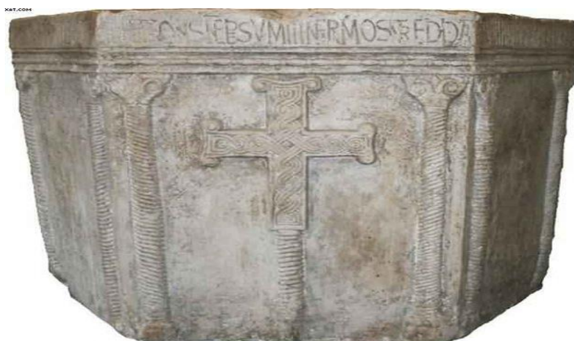
Slika 3. Krstionica kneza Višeslava

pokušaje sustavnoga korištenja latinskoga jezika, s asonancama i aliteracijama; Natpis kneza Branimira iz Muća Gornjeg datiran u 888. godinu; Nadgrobní natpis kraljice Jelene iz Solina datiran u 976. godinu koji je „vrhunski epigrafski spomenik koji svjedoči o vrlo visokoj razini latinske pismenosti u samoj zori hrvatskog življenja na ovom prostoru“ 11 ; Natpis kneza Držislava iz Kapitula kod Knina (10. stoljeće). Budući da se u to vrijeme pismenost najviše veže uz crkvu očekivano je da su svi natpisi zapravo dijelovi crkvenoga namještaja. Razina klesarske obrade slova epigrafske kapitale zadovoljava visoke kriterije, ali se ne može reći isto i za jezik, očigledno je da se zanemaruju temeljna gramatička pravila. Zapisi na pergamentu, sastavljeni u to vrijeme, sačuvani su samo u rijetkim prijepisima, npr. isprava kneza Trpimira gdje se prvi put svjedoči hrvatsko ime od samih Hrvata, i to s vladarskom titulom: dux Chroatorum.