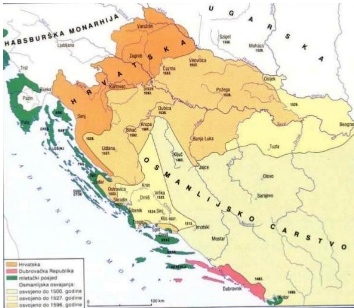
Prilog 2. Hrvatski teritorij od 1500.-1596.

kolovoza kreće preko mosta. Prelazak nije išao brzinom kakvom je sultan htio jer je most bio dosta uzak. Prelazak je završio 23. kolovoza. Grad su zapalili, opustošili, dok su sam most porušili. 122