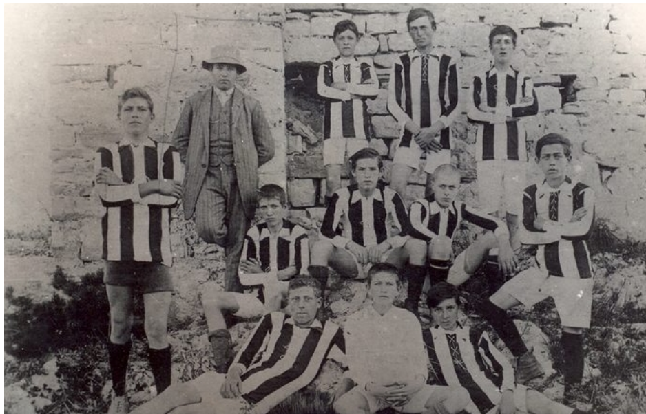
Slika 4. Članovi nogometnog kluba Anarh. Fotografija snimljena oko 1912. godine u Splitu.

Ipak, čin službene registracije bilo je samo, kako piše Milorad Bibić, "priznavanje na papiru", dok u stvarnosti vlasti nisu odobrile klupska pravila, a bilo je jasno da im ponajviše smeta ime Anarh. Povijest nekadašnjeg Anarha, a danas Radničkog nogometnog kluba Split, veže se uz Šimu Rosandića, osnivača i jednog od prvih igrača i trenera kluba. "Mi učenici Muške zanatske škole – maranguni – odlučili smo osnovati nogometni klub. Igrali smo za gušt, ali i iz protesta prema svakome zlu. Dugo smo smišljali kako dati ime klubu, meni je prvome palo na pamet ime – Anarhist! Poslin smo ga skratili u Anarh. Učinilo mi se to najbolje ime jer je ono u sebi imalo i – ništa drugo. A što drugo? E, neka to drugi misle!", rekao je Rosandić povodom sedamdesete godišnjice osnivanja kluba. 148 Klub je nekoliko puta raspuštan, a prva zabrana djelovanja od strane vlasti stigla je nakon sarajevskog atentata 1914. godine na prijestolonasljednika Franju Ferdinanda kada su članovi kluba odbili izvjesiti crnu zastavu u znak žalosti. 149