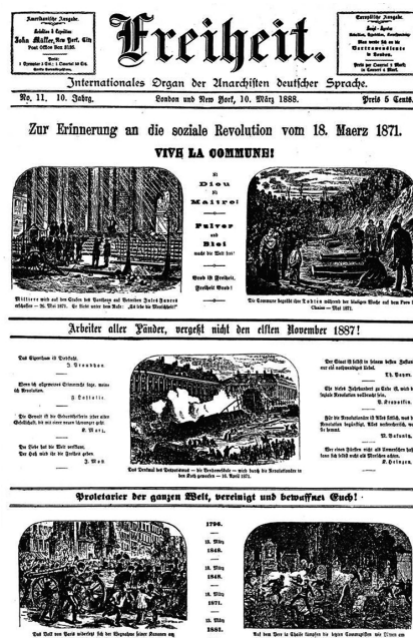
Slika 8. List Freiheit (pokrenut 1879.) kojeg je uređivao Johann Most (1846.-1906.), njemački anarhist i zagovornik revolucionarnog terorizma. Pretpostavlja se da je kružio i među hrvatskim radništvom. Naslovnica od 10. ožujka 1888. godine.