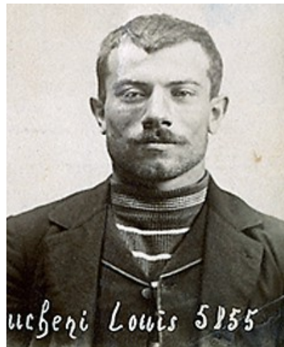
Slika 7. Luigi Lucheni (1873.-1910.), talijanski anarhist i ubojica ugarsko-hrvatske kraljice Elizabete 1898. godine.

Osječki kapucini spominju da se 10. rujna 1898. "zbio strašan zločin" kada je talijanski anarhist Luigi Luccheni ubio austrijsku caricu Elizabetu. 217