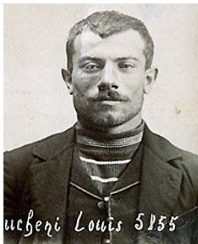
Slika 7. Luigi Lucheni (1873.-1910.), talijanski anarhist i ubojica ugarsko-hrvatske kraljice Elizabete 1898. godine.

Osječki kapucini spominju da se 10. rujna 1898. "zbio strašan zločin" kada je talijanski anarhist Luigi Luccheni ubio austrijsku caricu Elizabetu. 217