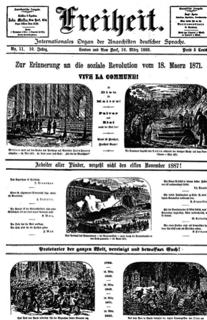
Slika 8. List Freiheit (pokrenut 1879.) kojeg je uređivao Johann Most (1846.-1906.), njemački anarhist i zagovornik revolucionarnog terorizma. Pretpostavlja se da je kružio i među hrvatskim radništvom. Naslovnica od 10. ožujka 1888. godine.