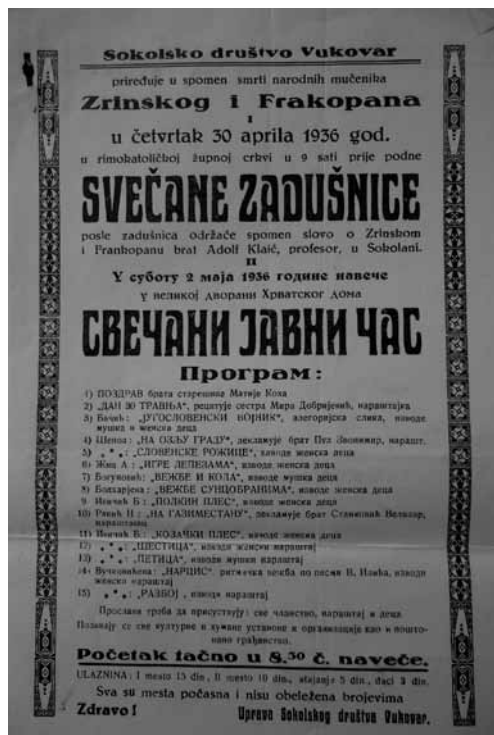
Prilog 5. Pozivnica s programom na svečanu zadušnicu koja se održavala u spomen na smrt Zrinskog i Frankopana, 1936. godina