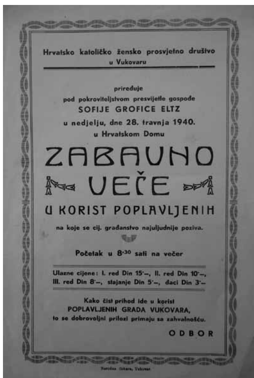
Prilog 2. Pozivnica "Hrvatskog katoličkog ženskog prosvjetnog društva" u Vukovaru na zabavnu večer, 1940. godina