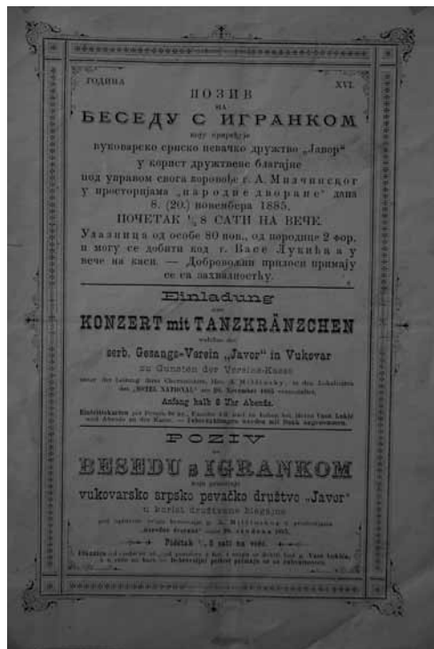
Prilog 8. Trojezična pozivnica na “Besedu s igrankom koju priređuje vukovarsko srpsko pevačko društvo Javor”, 1885. godina