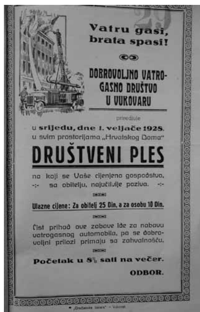
Prilog 3. Pozivnica “Dobrovoljnog vatrogasnog društva” u Vukovaru na društveni ples, 1928. godina