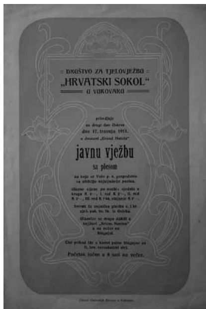
Prilog 12. Pozivnica društva “Hrvatski sokol” na “javnu vježbu sa plesom”, 1911. godina