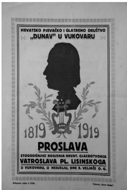
Prilog 7. Oglašavanje proslave stogodišnjice rođenja Vatroslava Lisinskog, 1919. godina