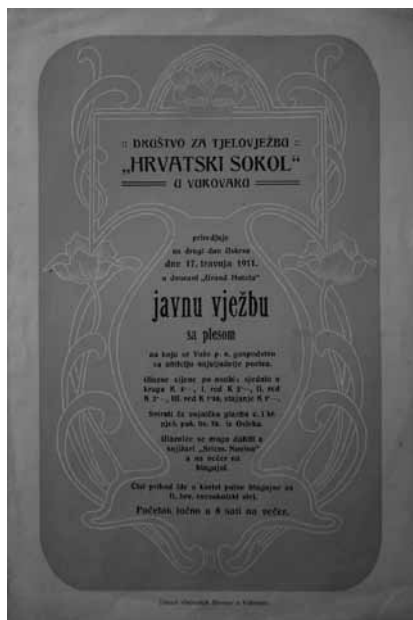
Prilog 12. Pozivnica društva “Hrvatski sokol” na “javnu vježbu sa plesom”, 1911. godina