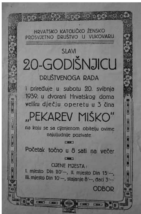
Prilog 6. Pozivnica na proslavu dvadesetogodišnjice rada Hrvatskoga katoličkog ženskog prosvjetnog društva u Vukovaru, 1939. godina