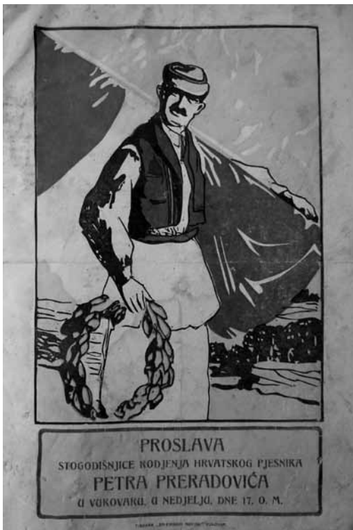
Prilog 10. Oglašavanje proslave stogodišnjice rođenja Petra Preradovića, 1928. godina