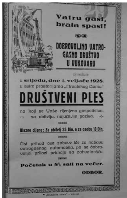
Prilog 3. Pozivnica “Dobrovoljnog vatrogasnog društva” u Vukovaru na društveni ples, 1928. godina