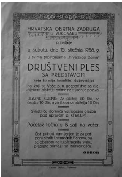
Prilog 13. Pozivnica “Hrvatske obrtne zadruge” na “društveni ples sa predstavom”, 1938. godina