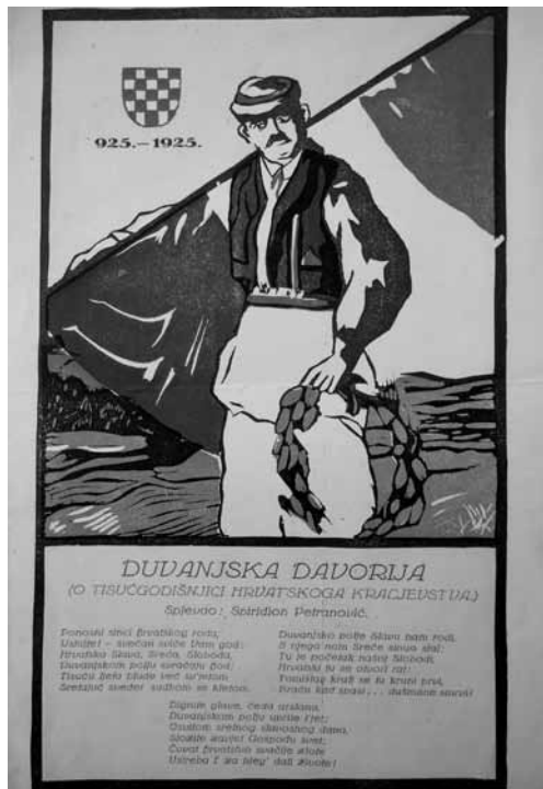
Prilog 9. Oglašavanje proslave “Tisućgodišnjice Hrvat- skoga kraljevstva”, 1925. godina