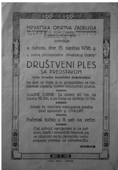
Prilog 13. Pozivnica “Hrvatske obrtne zadruge” na “društveni ples sa predstavom”, 1938. godina