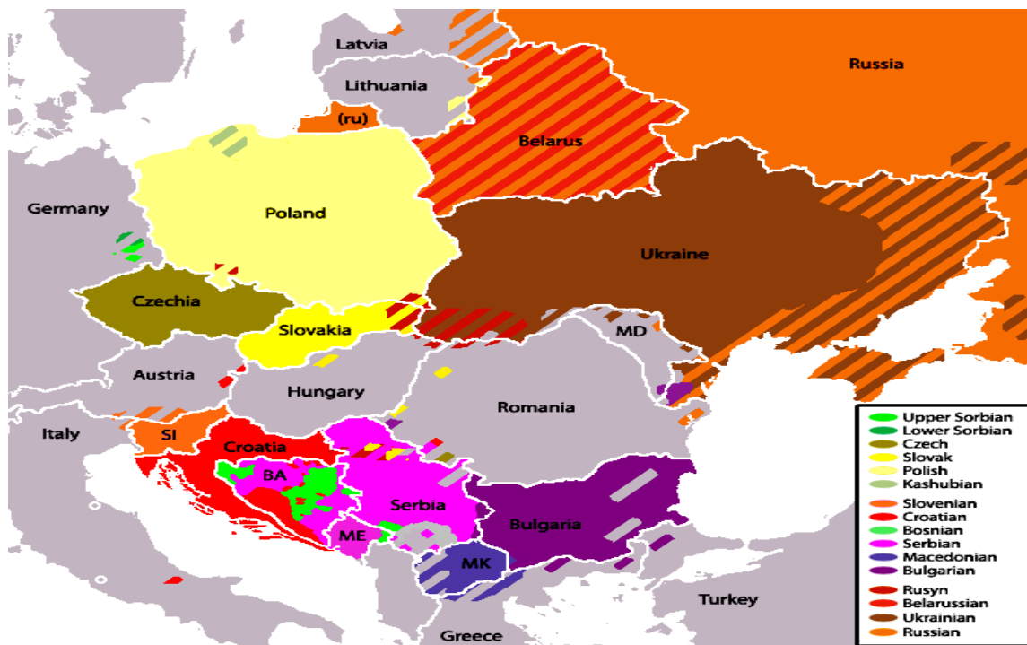
Slika 1. Slavenski jezici

standardni, što znači da zadovoljavaju trostupanjski model standardnosti 5 , koji uključuje sociolingvističku razinu, sociokulturnu i državno-političku razinu. Standardnost se jezika odnosi i na propisanu gramatiku, pravopis te leksik nekoga jezika. Deset je slavenskih standardnih jezika: ruski, ukrajinski, poljski, češki, slovački, slovenski, hrvatski, srpski, bugarski i makedonski. Jezici su to različite starosti, povijesti, vitalnosti, te broja govornika i vrijednosti. Važni su i oni slavenski jezici, koji još uvijek nisu stekli status standardnosti ili su, pak, takav status iz nekog razloga izgubili. Takvi se jezici nazivaju malim slavenskim književnim jezicima kao i malim slavenskim nestandardnim jezicima 6 . Mali istočnoslavenski književni jezik je zapadnopoleški, rusinski je jezik koji genetski potječe iz istočnoslavenskog i zapadnoslavenskog graničnog područja, mali zapadnoslavenski književni jezici jesu gornjolужиčki i donjolужиčki, te kašupski, a u male južnoslavenske jezike ubrajaju se rezijski, gradišćanskohrvatski, moliškohrvatski i banatskobugarski jezik.