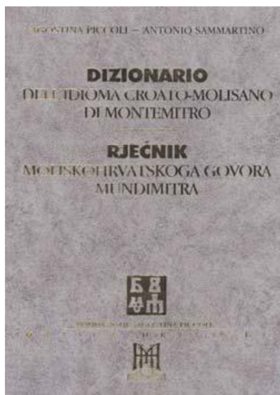
Slika 6. Rječnik moliškohrvatskoga jezika