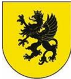
Slika 4. Kašupski grb

Kašupski jezik pripada zapadnoslavenskoj skupini jezika. Govornici ovoga jezika smješteni su na području Poljske, ali i izvan nje, ponajviše u SAD-u, Njemačkoj i Kanadi. Broj govornika kašupskoga jezika iznosi oko 50 000. Dijalekt kojim govore je njihov vlastiti, te slovinački (slovinski) kojim govore Slovinci. Govornici imaju status jezične grupe, a ne nacionalne. Riječ kašub dolazi od riječi 'kassub' koja označuje tradicionalni ogrtač pripadnika ove jezične grupe. Kašupski je jezik najbliži poljskom jeziku s kojim dijeli veći dio rječnika, gramatiku i načine tvorbe riječi. Zapisuje se prema pravilima poljske ortografije, a od 15. st. latiničnim pismom. Standardizacija kašupskoga jezika nije provedena tako da pišu vlastitim dijalektom. Karakterizira ga inverzija susjednih fonema, po čemu se razlikuje od ostalih slavenskih jezika, pr. kaš. gard – polj. gród 'grad, tvrđava'.