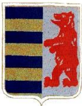
Slika 2. Grb Rusnaka - prikazuje crvenog medvjeda okrenutog prema plavim i zlatnim linijama

Rusini (Rusnaci, Ruteni) su maleni narod iz grupe istočnih Slavena čija se stara postojbina nalazila u Prikarpatskoj Rusiji, odnosno dijelu Ukrajine, na granici s Poljskom, Slovačkom, Mađarskom i Rumunjskom. Članovi ovoga naroda, njih milijun i pol, žive u raznim europskim državama, te u Americi i Australiji. Migracije Rusina počele su u 14. st. i to najprije iz Zakarpatja i Karpata u Potkarpatje, a kasnije i u mađarska sela. Danas ih je u Europi najviše u Karpatskom području i to u jugozapadnoj Ukrajini, sjevernoj i sjeveroistočnoj Slovačkoj, na sjevernim padinama Karpata, u jugoistočnoj Poljskoj, u dijelu sjeverne Rumunjske, u nekoliko sela južno od rijeke Tise u oblasti Maramures, u nekoliko raštrkanih naselja sjeveroistočne Mađarske. Osim u postojbini, žive i u Vojvodini, zapadnom Srijemu, istočnoj Hrvatskoj, u Pragu i sjevernoj Mađarskoj. Riječ Rusnak/Rusin dolazi od riječi Rus, s dodatkom -in je Rusin, a -njak Rušnjak. 7 Na mađarskom je jeziku Rusnyak prema Rusnak u prikarpatskoj Rusiji. Tradicionalni zapadni znanstvenici tvrde da ime Rus potječe iz staroga naroda skandinavskoga podrijetla Varangiana koji se preselio južno od baltičke obale i osnovao prvu državu među istočnim Slavenima, sa središtem u Kijevu. U prilog ovoj teoriji ide grb Rusnaka. Grb je prihvaćen 30. ožujka 1920. godine kao grb provincije Potkarpatska Rus u Čehoslovačkoj.