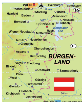
Slika 5. Karta Gradišća

Gradišćanskim Hrvatima nazivamo potomke onih Hrvata koji su tijekom 16. st. naselili područja zapadne Mađarske, istočne Austrije, zapadne Slovačke i istočne Moravske.