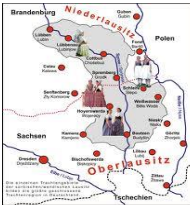
Slika 3. Područje Gornje i Donje Lužice

Time su postojana i dva književna jezika: gornjolужиčkosrpski književni jezik i donjolужиčkosrpski književni jezik. Gornjolужиčkosrpski jezik prema svojim je obilježjima sličniji češko-slovačkom jeziku, dok je donjolужиčkosrpski bliži lehitskim jezicima.