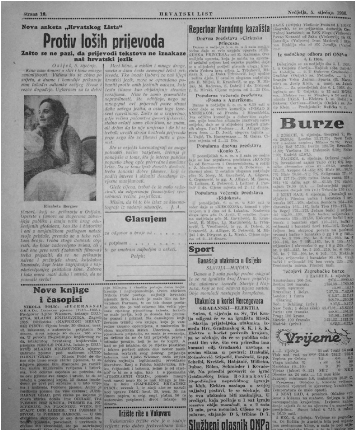
Slika 2. Rubrike u „Hrvatskom listu“, izdanje od 5. siječnja 1936.

Novine „Die Drau“ pregledane su od prve do zadnje godine izlaza, 1 a analizirano je 98 brojeva. Novine „Slavonische Presse“ pregledane su od druge godine izlaza, 2 tj. 1886., do 1917. godine, a analizirano je 56 brojeva. Novine „Narodna (Hrvatska) obrana“ pregledane su od prve do zadnje godine izlaza, a analizirano su 34 broja. Naposljetku, analizirano je 39 brojeva „Hrvatskog lista“, objavljenih također od prve do zadnje godine izlaza. Sveukupno je, dakle, analizirano 227 pojedinačnih brojeva izdanja četiriju novina u razdoblju od 1868. do 1945. godine, a posebna se pozornost pridala rubrikama, njihovom sadržaju, mijenjanju naziva rubrika, grafičkom oblikovanju i