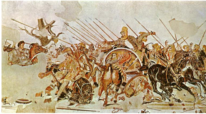
Prilog 3. Aleksandar Veliki i Darije-mozaik u Pompejima

povlačiti sve više uz obalu. Razvila se strahovita bitka, borac na borca. Na desnom krilu Makedonci su sve više potiskivali Perzijance, tjerajući ih sve bliže rijeci. Ugledavši helenske najamnike, napustili su Perzijance i žesto udarili na njih. Na tom mjestu je počela borba do uništenja, jer Makedonci su nemilosrdno mrzili Darijeve najamnike.