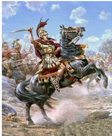
Prilog 1. Aleksandar Veliki i njegov konj Bukefal

Aleksandar III. Veliki, zvan i Aleksandar Makedonski, rođen je 356.pr. Kr., kao član vladarske dinastije Argead, te sin makedonskog kralja Filipa II. Makedonskog i epirske princeze Olimpijade. Aleksandar je od svoje 14. godine bio i učenikom najvećeg filozofa i znanstvenika svoga vremena Aristotela, kojega je njegov otac Filip pozvao u Makedoniju da bude Aleksandrov učitelj. 1 Aristotel je ostao na makedonskom dvoru sve dok Aleksandar nije došao na prijestolje. Aristotel ga je poučavao logici, metafizici i politici, a bio je zaslužan i za poticanje njegova dubokog zanimanja za znanstveno istraživanje i geografiju. Kada mu je bilo šesnaest godina, otac Filip mu je prvi puta povjerio samostalnu upravu nad zemljom. Ukazano povjerenje Aleksandar je i više nego opravdao krenuvši na pohod protiv Meda u Trakiji, ovjekovječivši svoj podvig time što je na pokorenoj zemlji osnovao grad, kojemu je dao svoje ime Aleksandropol. 2 Od tog vremena Aleksandar je neprestano bio uz svog oca.