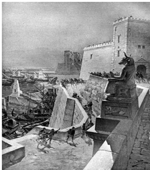
Prilog 4. Opsada Tira, Andre Castaigne

Nakon pobjede nad Darijem u bitci kod Isa, svi feničanski gradovi su se predali bez otpora, osim Tira. Aleksandar, namjeravajući prebaciti vojsku u Egipat, odlučio pod svaku cijenu osvojiti Tir, da mu iza leđa ne bi postojalo perzijsko uporište. Tir je strateški važan grad na obali Fenikije, prostor današnjeg Libanona. Novi grad Tir je bio smješten na otoku i imao jako dobra utvrđenja, u potpunosti okružen morem. Aleksandar je srušio stari grad Tir i taj materijal je upotrijebljen za gradnju mola. Kada je bio sagrađen morski put od obale do grada, bio je dug 1 kilometar i sedamdeset metara širok. 23 U toku rada Tirani su nekoliko puta, ploveći brodovima oko nasipa, napadali Makedonce, više spremne za rad, nego za borbu i mnoge pobili strijelama i kopljima.