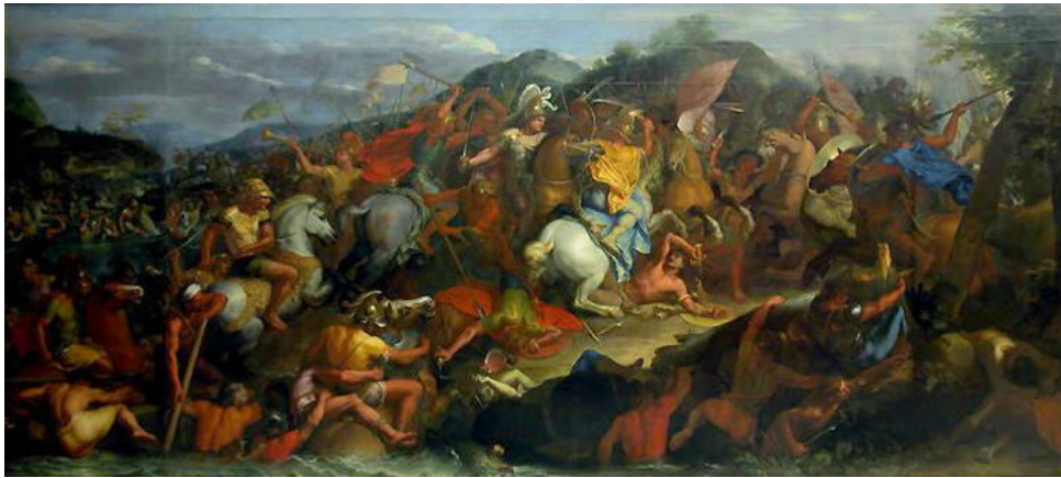
Prilog 2. Bitka kod Granika, Charles Le Brun

zamjenu uzeo oružje iz hrama, između ostaloga i sveti štit, za koji se smatralo da je pripadalo Ahileju, te odao poštovanje svom omiljenom junaku položivši vijence na njegov grob i priredio svečane igre u njegovu čast. 12 Zatim se vratio i s cjelokupnom vojskom krenuo duž obale u pravcu sjeveroistoka ususret neprijatelju koji se već utaborio kod Zeleja na obalama Propontide. U Zeleji se skupila perzijska vojska, oko 20 000 konjanika i isto toliko pješaka, većinom helenski dobrovoljci. Usput mu se predao grad Lampsak. U Zeleji je jedan od glavnih vođa Perzijanaca bio i satrap Lidije i Jonije Spitridat, oholi Perzijanac, ropski odan caru Dariju. 13 Do sukoba s neprijateljskom vojskom došlo je na rijeci Granik u rano ljeto 334.pr. Kr. To je prva od triju glavnih bitaka koje je Aleksandar vodio protiv Perzijskog Carstva.