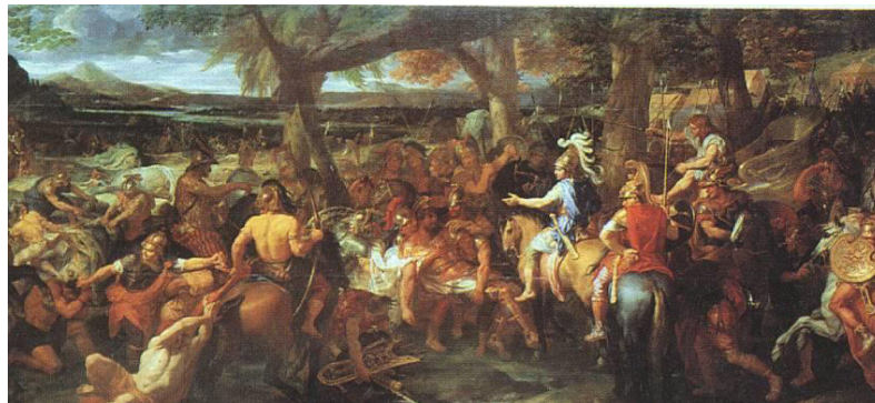
Prilog 6. Bitka na Hidaspu, Charles Le Brun

Za Aleksandra najveći problem su bili slonovi. Slonove koje je dobio od Taksile nije poveo, jer makedonski konji nisu navikli na njih i oni su mogli samo biti smetnja. Također, velika opasnost kod prijelaza preko Hidaspa ležala je u tome da se konji kod iskrcavanja, kad vide slonove mogu uplašiti i skočiti u vodu. Stoga je Aleksandar odlučio da prijeđe rijeku na drugom mjestu nizvodno od tabora Pora. Kako bi prevario Pora i prošao neopaženo, svake večeri je naredio nekolicini konjanika da jašu na raznim mjestima, kao da se spremaju za prijelaz, tako da je Por više puta kretao sa slonovima, ali svaki puta je to bila lažna uzbuna.