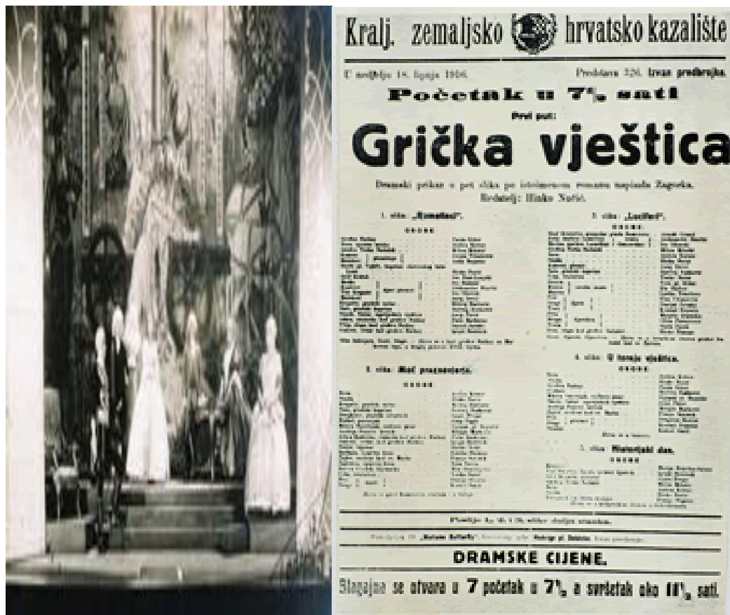
Slika 1. Grička vještica , obnova iz 1929. godine 54