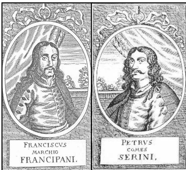
SLIKA 3: Fran Krsto Frankopan i Petar Zrinski

u latinicu. 8 Upravo su one naznačile predmetni interes Josipa Vončine, a to je hrvatski pisani jezik od svojih početaka i Frankopani, odnosno pisci i jezik ozaljskoga književno-jezičnoga kruga. 9 Priređujući za Akademijinu ediciju Stari pisci hrvatski djela Frana Krste Frankopana, Josip je Vončina napisao i ovu rečenicu: „Ni jednome članu obitelji Vuka Krste Frankopana ne znamo godine rođenja, a za njega i njegovo potomstvo poznate su godine smrti jer su izračunate prema pojedinim mjestima u raspravama (ponajprije frankopanskim). Za samoga pak Frana Krstu Frankopana ne znamo sasvim sigurno ni tko mu je bila mati. »Budući da mu majkom nije