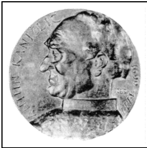
SLIKA 2: Antun Kanižlić