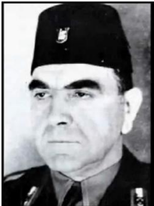
Prilog 1. Pavelić s fesom 70