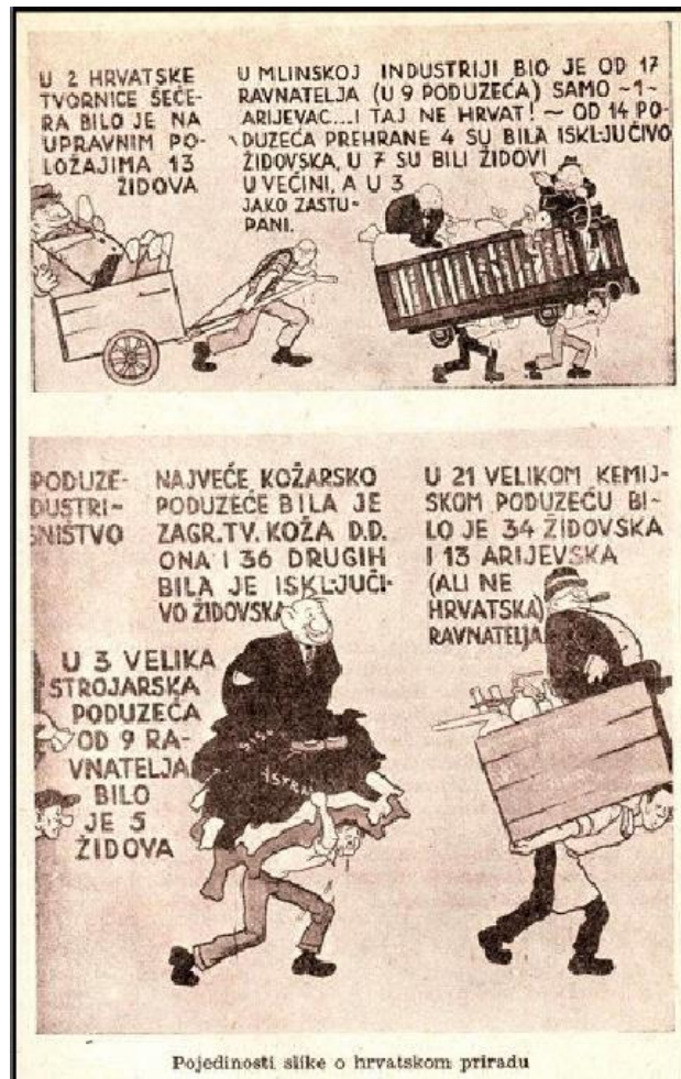
Prilog 3. Opis: Slika sa izložbe Židovi koja prikazuje ustaško viđenje iskorištavanje Hrvata od strane Židova 72