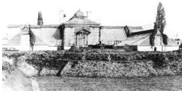
Slika 11. Botanički vrt PMF-a, staklenici 1900. godina, Zagreb.

URL: http://hirc.botanic.hr/vrt/hrv/o_vrtu_Povijest.htm (2011-09-09)