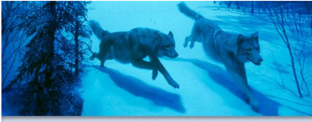
Slika 7. Diorama u American Museum of Natural History, New York. URL: http://www.amnh.org/exhibitions/dioramas/wolf/ (2011-09-09)