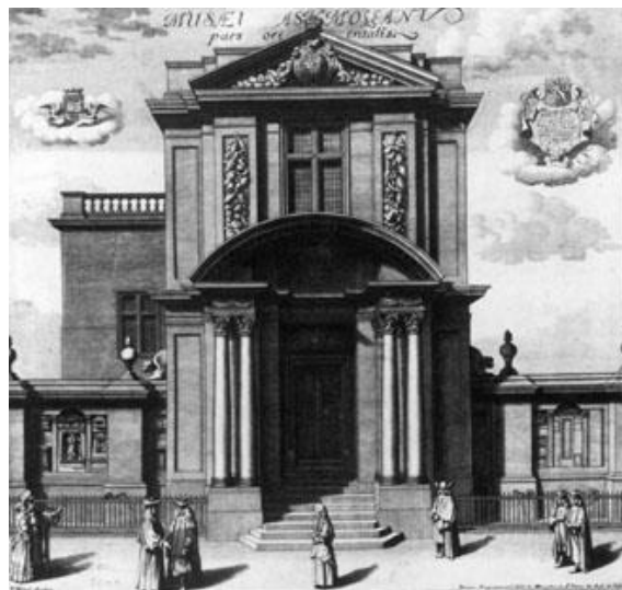
Slika 2. The Ashmolean Museum, Velika Britanija, 1683.

URL: http://www.kunstkammer.at/imperaum.htm (2011-09-09)