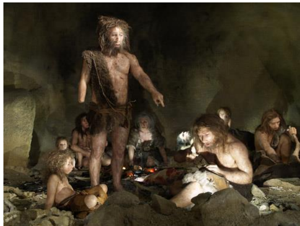
Slika 8. Rekonstrukcija okoliša u Muzeju krapinskih neandertalaca, Krapina. URL: http://www.mhz.hr/krapina.html (2011-09-09)