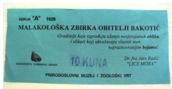
Slika 10. Prirodoslovni muzej i zoološki vrt, Split, Ulaznica.

http://www.prirodoslovni.com/inventarna/search.php?display_zbirka=1&Oznaka_zbirke=A04+ZBIRKA+MORSKIH+MEKU%C5%A0ACA# (2011-09-09)