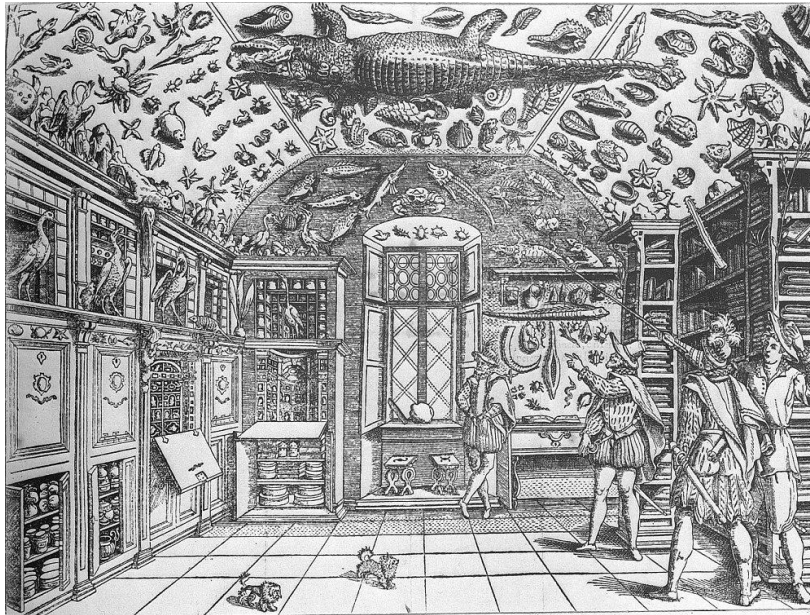
Slika 1. Kabinet čudesna Ferrante Impera, Italija, 1599.

URL: http://www.kunstkammer.at/imperaum.htm (2011-09-09)