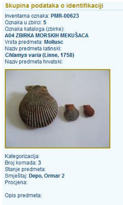
Slika 9. Primjer zapisa iz inventarne knjige Prirodoslovnog muzeja Rijeka.