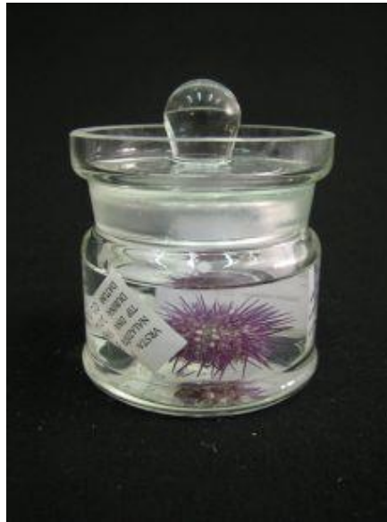
Slika 5. Čuvanje bodljikaša u Prirodoslovnom muzeju Rijeka.