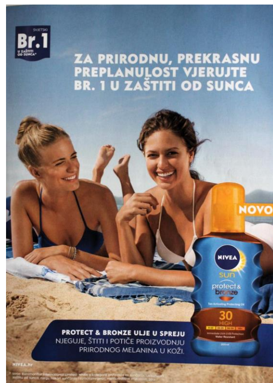
Slika 6: Reklama za Niveu (SB: 49)

Iz priložene reklame vidimo da su informacije o poduzetim istraživanjima ili samoprocjenama napisane sitnim i teško čitljivim slovima, ali su zato informacije dobivene istraživanjem značajno istaknute u postotcima ili zaključcima poput onih iznesenih u znanstvenom radu. Kao u prethodnom primjeru, u mnogim reklamama kozmetičkih proizvoda koje donose objavu nekog istraživanja česta je upotreba zvjezdice (*), koji donosi neku obavijest o tome kako je istraživanje, čiji su rezultati uvijek istaknuti, provedeno. Obje su reklame zasićene tekstem i informacijama koje su nepregledne, a navodi o tome kako je provedeno istraživanje ili odakle su izvučeni podatci na koje se reklama referira služe ograđivanju samog subjekta od mogućih tužbi