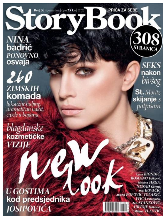
Slika 2: StoryBook časopis, br. 5 (2010)