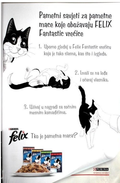
Slika 9: Reklama za Felix hranu za mačke (SB: 25)

Reklama za hranu za mačke FELIX Fantastic (SB: 25) sloganom Tko je pametna maca? nadovezuje se na televizijsku reklamu istog proizvoda, ali i progovara u perspektivi obraćanja mački, Izvali se na leđa i očaraj vlasnika; Uživaj u nagradi sa sočnim mesnim komadićima . Takva vrsta međusobne komunikacije dvaju medija pozitivno utječe na sliku reklame i postiže veću zapaženost.