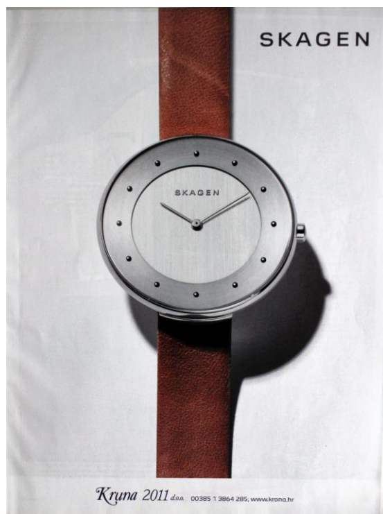
Slika 8: Reklama za Skagen ( Grazia 194:9)