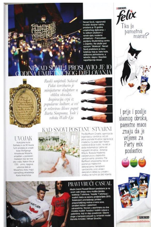
Slika 10: Isto (SB: 27)

Časopisi omogućuju prijenos novih informacija koje nisu prisutne u televizijskoj reklami i tako pružaju novu percepciju televizijskih reklama. (Consterdine, 2005: 7) Ako se vratimo na jednostavan model oglašavanja (dijagram 1), možemo vidjeti kako oglašavanje u dva ili više medija