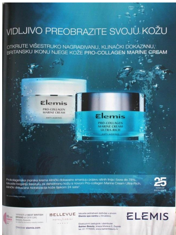
Slika 5: Reklama za Elemis (SB: 166)

U reklamama u ženskim časopisima često je intermedijalno ispreplitanje slike i teksta. Reklame za kozmetičke proizvode, kojih je uz modne proizvode najviše, najčešće su informativnog tipa, gdje uz sliku idealizirane žene i proizvoda donose brojne informacije o proizvodu koji se reklamira, naravno, ističući sve njegove prednosti u odnosu na druge proizvode. Iznese informacije često su nadopunjene gotovo znanstvenim podacima te u njima možemo pronaći znanstveni stil u reklamnom podstilu ženskih časopisa.