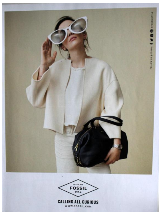
Slika 7: Reklama za Fossil ( Grazia 195:7)

Potpuna su suprotnost reklame za odjevne predmete koje su u potpunosti zasnovane na prenošenju estetike i duha proizvoda ili marke s minimalno teksta.