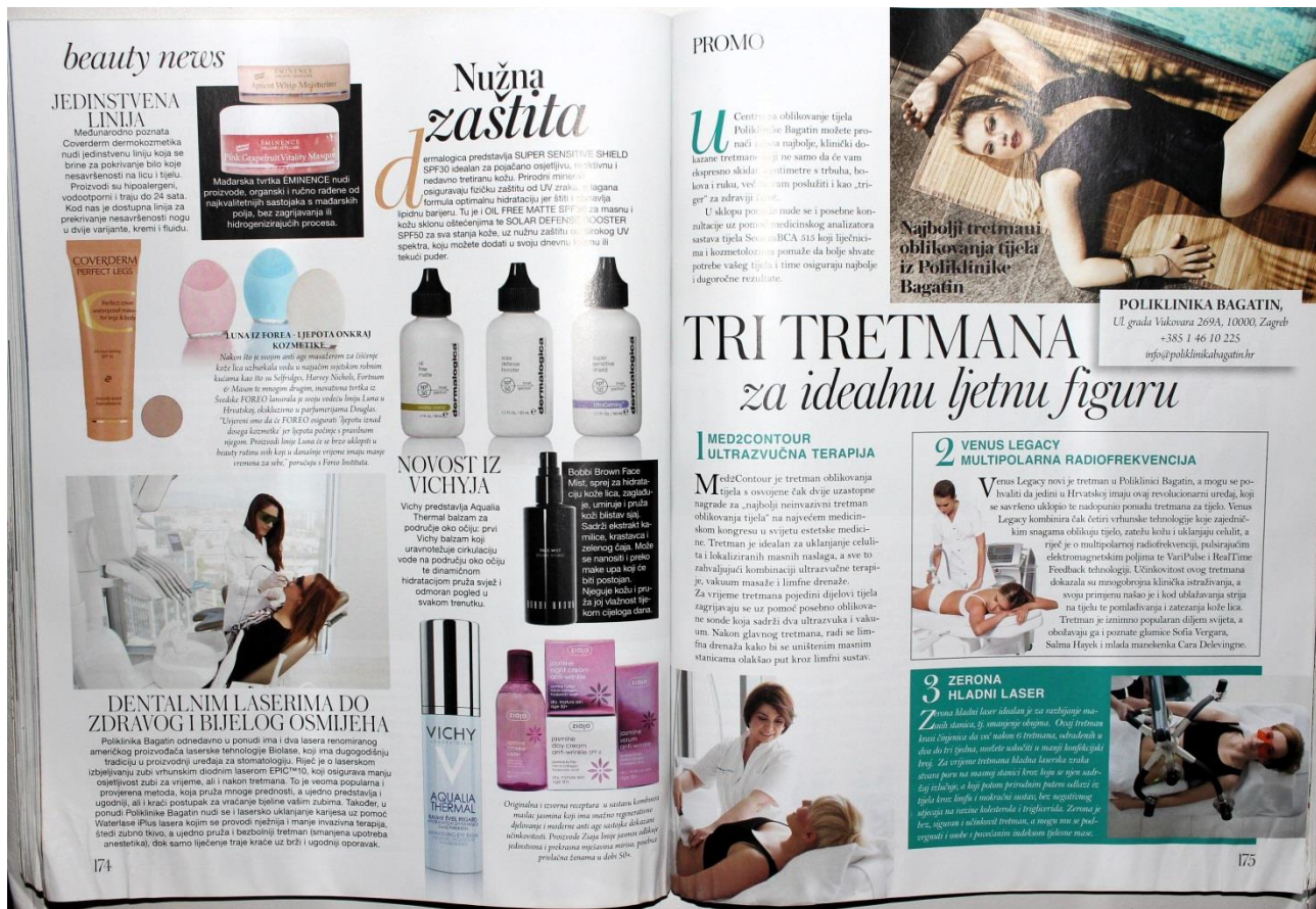
Slika 14: Rubrika beauty news i promotivni članak (SB: 174-175)

Odricanje od odgovornosti promotivnog članka koji se nalazi na desnoj strani (slika 14.) već je spomenuti izraz PROMO , no na lijevoj strani u rubrici beauty news također nalazimo segment o Poliklinici Bagatin koja je subjekt promotivnog članka s desne strane. Tu nemamo takve napomene. Je li takav sadržaj objektivna vijest i na njega ni na kakav način nije utjecao ugovor za pet stranica promotivnog članka?