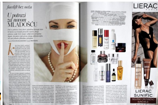
Slika 13: Editorijal (SB: 164-166)

Grafički su editorijali, autorski članci i promotivni članci slično oblikovani. I na lijevom i desnom prilogu vidimo modela (ili modele) koji svojim izgledom pristaju uz temu editorijala ili promotivnog članka. Oba teksta započinju naslovom koji ispod nosi kratko objašnjenje. Početno slovo stilizirano je na sličan način. Korišten je isti stil slova. Proizvodi koji se nadovezuju na tekst organizirani su po nekoj logici. Jedino što izdvaja promotivni članak jest riječ PROMO u gornjem lijevom kutu članka i činjenica da su u članku navedeni isključivo proizvodi jednog proizvođača.