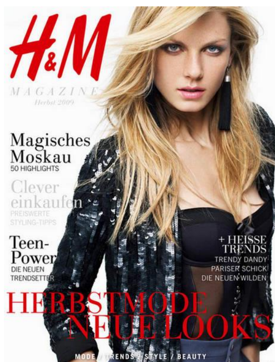
Slika 1: H&M časopis, jesen 2009.

markom koja se reklamira. Takvim pristupom imitiraju već spomenut način komunikacije ženskih časopisa koji čitateljima ulijeva povjerenje i ostavljaju dojam ekskluzivnosti nalik plaćenom sadržaju. Na primjeru StoryBook časopisa (slika 2.) i H&M reklamnog časopisa (slika 1.) ne primjećujemo velike razlike, na naslovnici se nalazi žena, poznata osoba ili manekenka, nekoliko naslova tekstova iz samog časopisa ( HERBST MODE vs. 260 ZIMSKIH komada ili Magisches Moskau vs. St. Moritz skijanje s potpisom ), a na oba časopisa grafički najveći je upravo tekst NEUE LOOKS tj. new look , evocirajući tako želju za promjenom i novim izgledom. 8