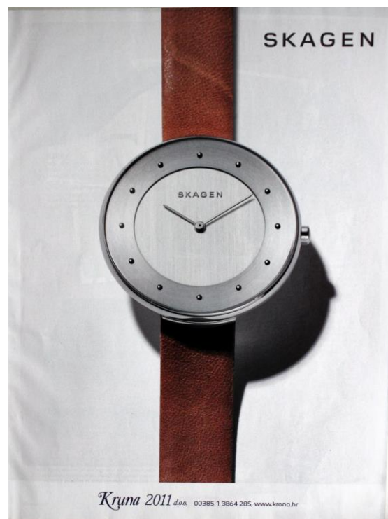
Slika 8: Reklama za Skagen ( Grazia 194:9)