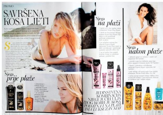
Slika 12: Promotivni članak (SB:180-181)

tzv. viralnih oglasa. 26 Promotivni članci, žanr koji se sve više može pronaći u ženskim časopisima, izgledom imitiraju ostale članke u časopisima (rasporedom slika i teksta, fontom, grafičkim oblikovanjem), ali sadržajem služe isključivo promociji određenog proizvoda. U 23. broju časopisa Storybook koji izlazi svaka 3 mjeseca pronađeno je ukupno 25 stranica na kojima je u potpunosti ili dijelom bio prisutan promotivni članak (Tablica 1.). Velik broj promotivnih članaka bili su posvećeni medicinskim zahvatima, a promotivni članak za Polikliniku Bagatin proteže se na 5 stranica (slika 14.). Na tim stranicama pokriveni su njihovi tretmani oblikovanja tijela, estetska stomatologija... Sam članak oblikovan je kao i svaki drugi, no isključivo je posvećen jednoj temi. Kao i kod drugih promotivnih članaka, više puta su navedeni kontakt podatci: telefon, email i adresa web stranice.