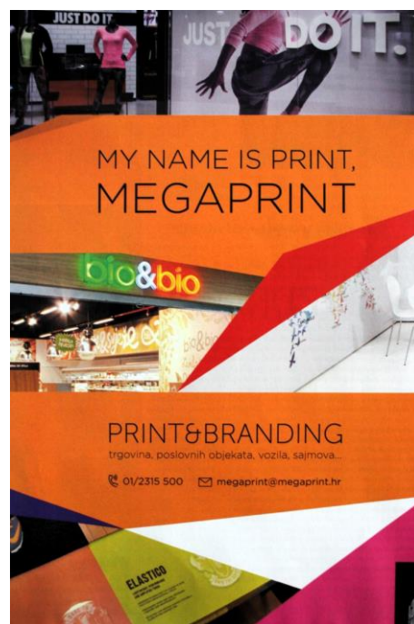
Slika 4: Reklama za Megaprint (SB: 226)