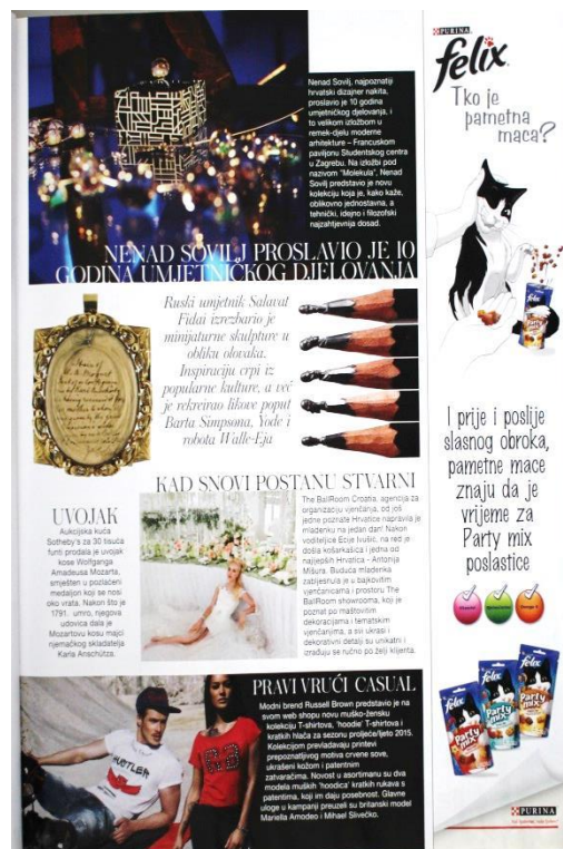
Slika 10: Isto (SB: 27)

Časopisi omogućuju prijenos novih informacija koje nisu prisutne u televizijskoj reklami i tako pružaju novu percepciju televizijskih reklama. (Consterdine, 2005: 7) Ako se vratimo na jednostavan model oglašavanja (dijagram 1), možemo vidjeti kako oglašavanje u dva ili više medija