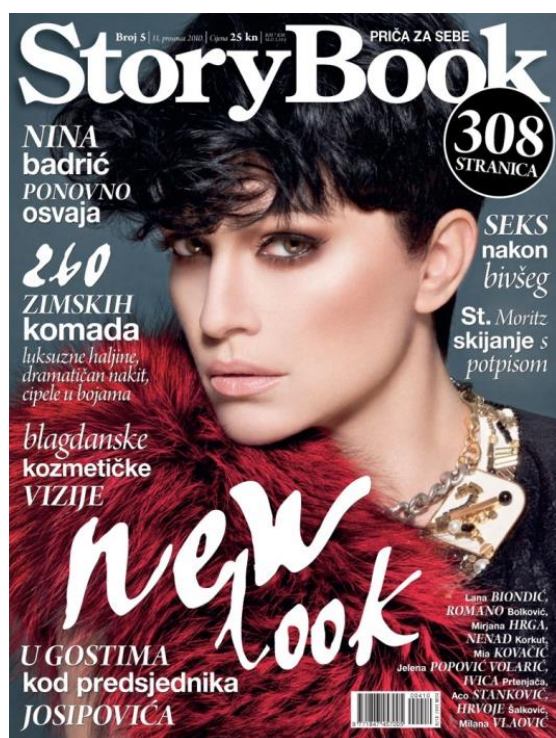
Slika 2: StoryBook časopis, br. 5 (2010)