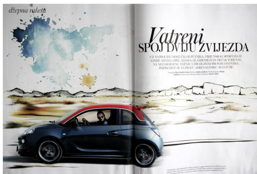
Slika 3: Reklama za Opel Adama (SB: 268)

Jezični elementi jesu primarno, često i jedino sredstvo reklamnoga izraza, no oni ponekad smisao tvore tek sa svojom vezom s parajezičnim kodom reklame, odnosno našim razumijevanjem subtekstualne podloge i ideoloških vrijednosti na čijim osnovama su građene.