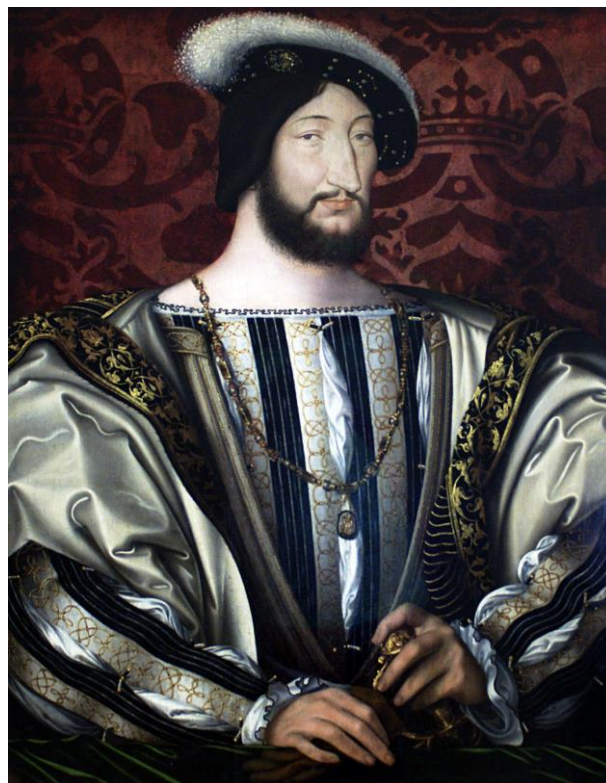
Prilog 2. Portret Françoisa I., Jean Clouet (cca 1535. god.)