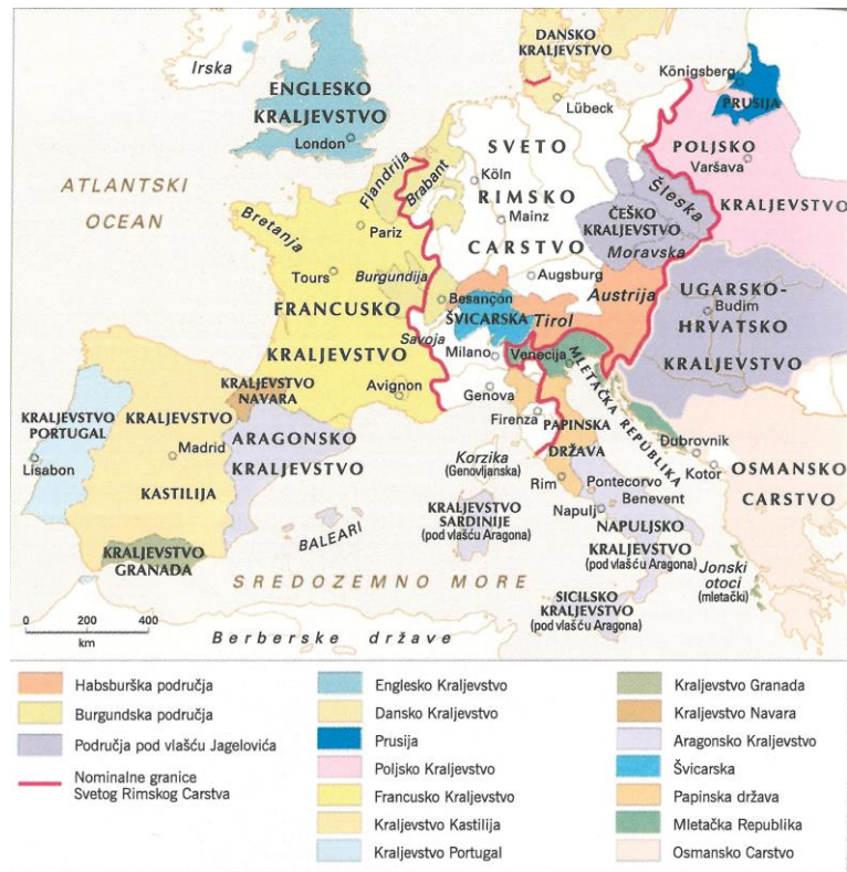
Prilog 1. Europa krajem 15. i početkom 16. st.