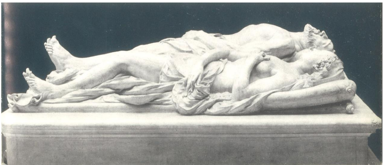
Prilog 6. Gisants Henrija II. i Katarine Medici, Germain Pilon (1563.-1570.)