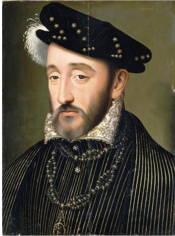
Prilog 3. Portret Henrija II., François Clouet (1547. god.)