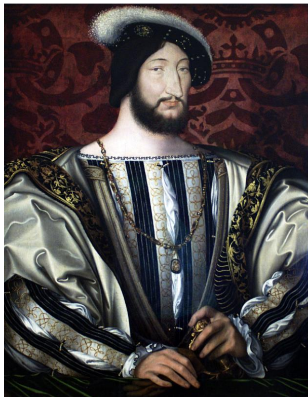
Prilog 2. Portret Françoisa I., Jean Clouet (cca 1535. god.)