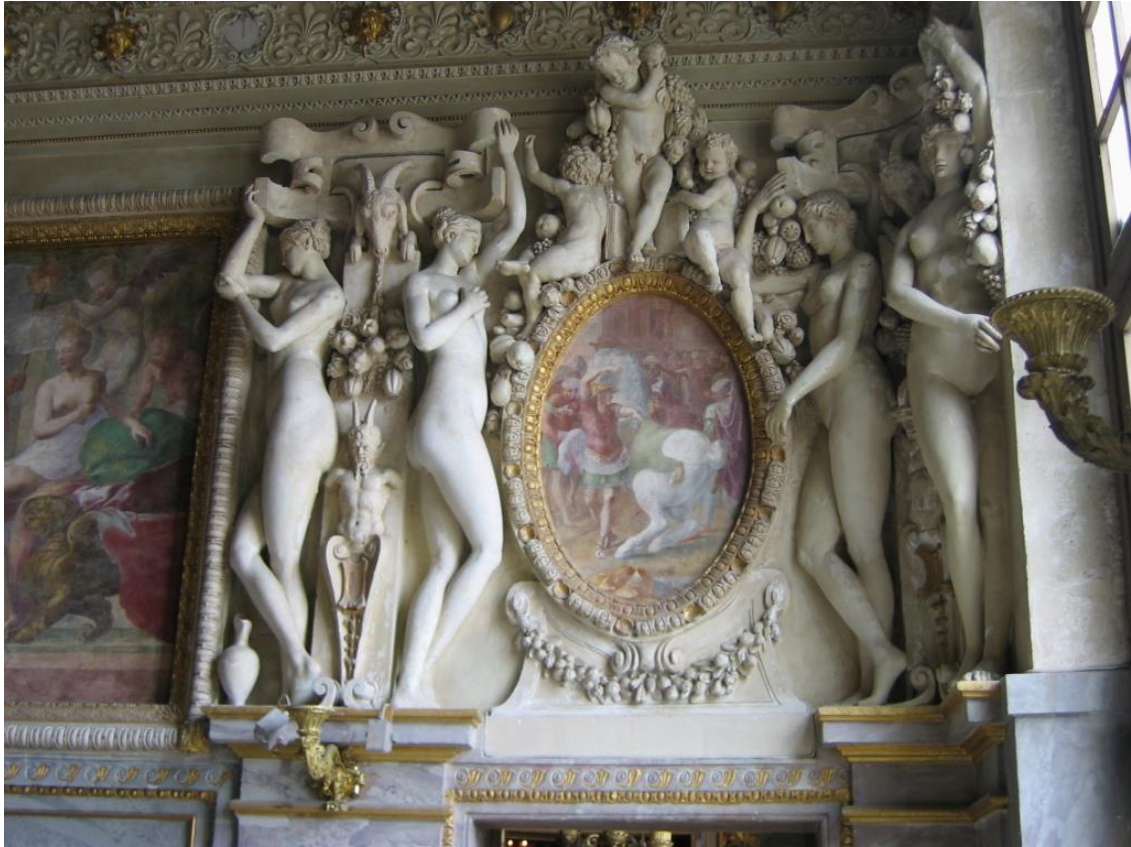
Prilog 5. Odaja vojvotkinje d'Etampes u palači Fontainebleau, Francesco Primaticcio (1530.-tih ili 1540.-tih god.)