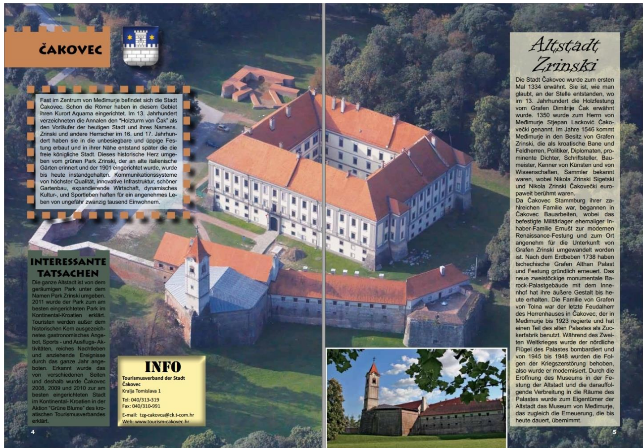
Bild 2: Beispiel eines Kapitels der deutschen Übersetzung von „Utvrd e i dvorci“

Der Rest der Broschüre ist auf Kapitel eingeteilt, je eine Stadt pro Kapitel. Jedes Kapitel hat 2 Seiten und beinhaltet ein großes Hintergrundbild eines relevanten Kulturdenkmales, das beschrieben wird. Oben links befindet sich der Name der Stadt mit Stadtwappen. Unten befinden sich Textschachteln mit kurzer Beschreibung der Stadt, Beschreibung eines relevanten Schlosses oder der Altstadt, zusammen mit einem kleineren relevanten Foto. Weiter erscheint eine Textschachtel mit interessanten Tatsachen und zuletzt hat noch jedes Kapitel eine kleine Textschachtel mit relevanten Informationen über den Tourismusverband der beschriebenen Stadt.