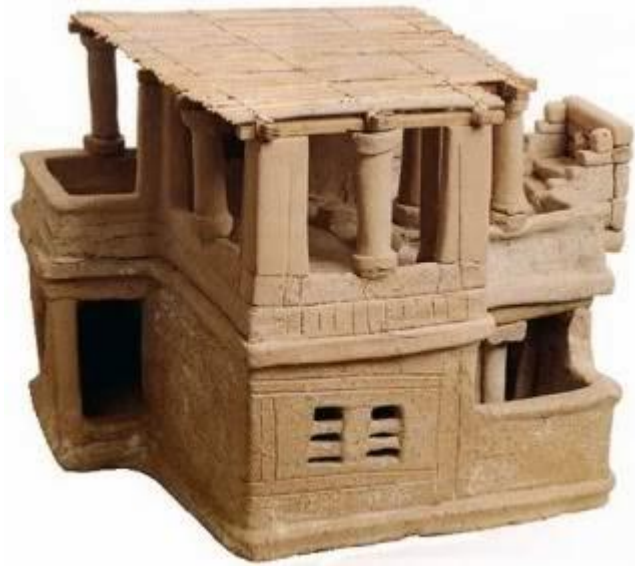
Slika 1. Glineni model kuće pronađen južno od Knososa

U 8. st. pr. Kr. arhitektura doživljava procvat. Naime, počinju se graditi zgrade pravokutnog oblika, elegantne i profinjene, obilježene trijemom na stupovima, dok su se dotad gradile dugačke građevine koje su završavale apsidama ili eliptičkim formama. I kuće su također poprimile pravokutni oblik, a njihove su prostorije bile raspoređene oko središta, u kojem je bio vrt. 8 Jedini izvori na temelju kojih se može zaključiti kakav je bio raspored prostorija unutar kuće na Kreti otkrivaju očuvani temelji kuća i modeli od terakote. 9