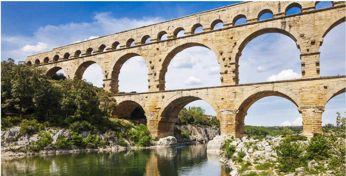
Slika 4. Akvedukt Pont du Gard, Provansa, Francuska