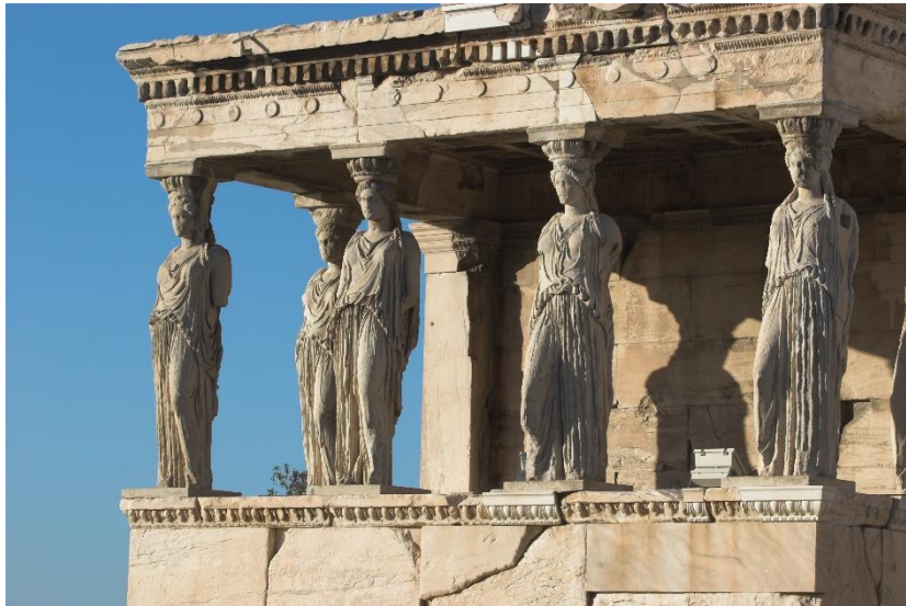
Slika 2. Erehtejon – trijem s karijatidama

Hram božice Atene Nike je amfiprostilni tetrastil to jest, hram s po četiri stupa s prednje i stražnje strane. 86 Miniijturni hram Ateni Niki je izgradio Kalikrates. 87 Hram božice Atene Nike je amfiprostilni tetrastil to jest hram s po četiri stupa s prednje i stražnje strane, 88 dimenzija svega 4 x 4,5 metra. Stupovi pripadaju jonskom redu. 89