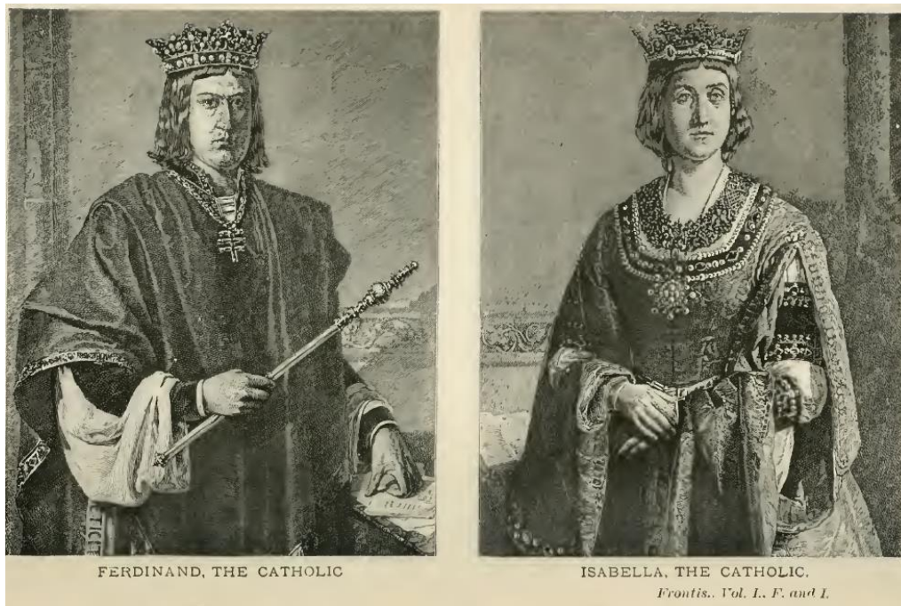
Prilog 3. Ferdinand Aragonski i Izabela Kastiljska