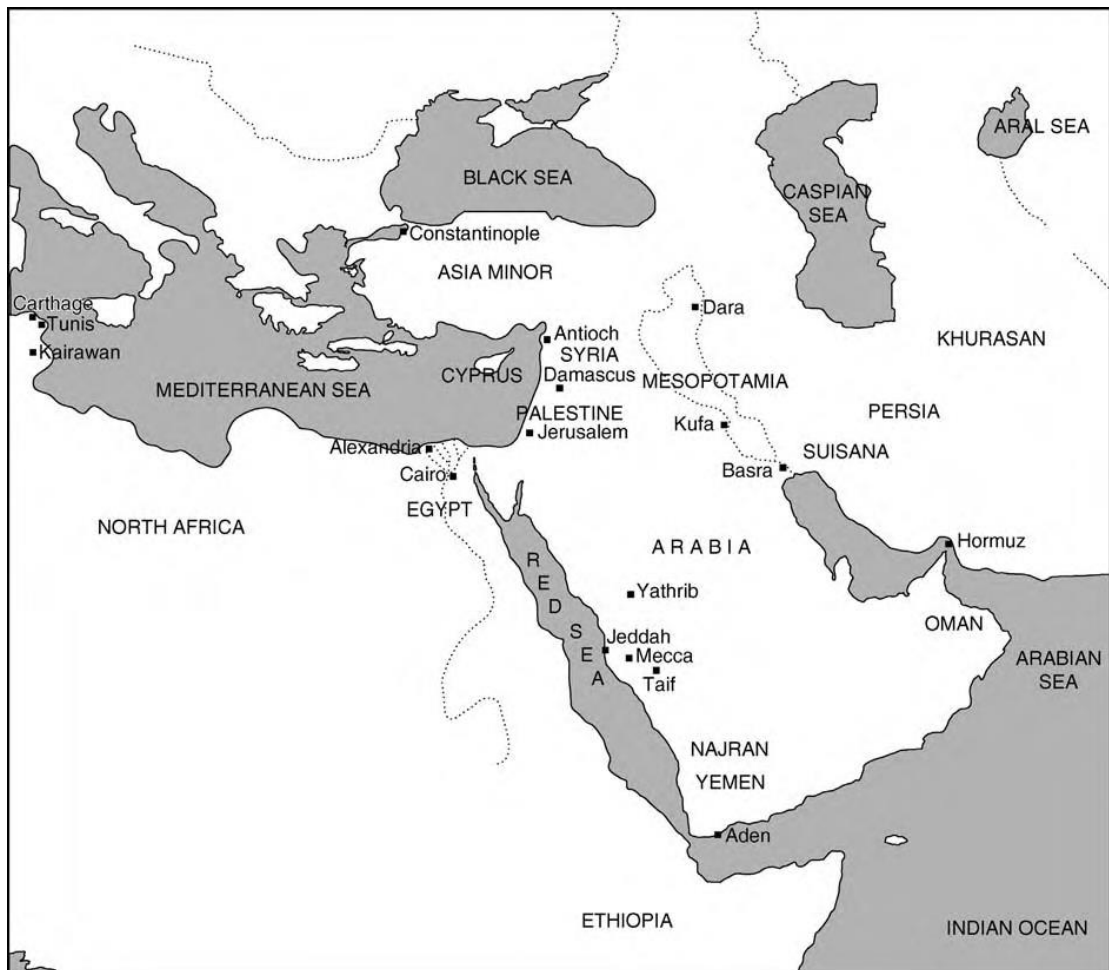
Prilog 1.: Arabija, oko 600. godine

Prije nego što se islam pojavio i prije nastanka arapske države, arapsko stanovništvo je živjelo u plemenskoj organizaciji. Pretežno su uzgajali ovce, koze i deve. Temeljne jedinice društva su bili obitelj, rod, pleme i savez plemena. 3 Pleme je činio krug šatora, a u svakom šatoru je živjela jedna obitelj pod vlašću patrijarha. Jedno pleme je međusobno bilo povezano rodbinskim vezama. Glavari plemena, šeici, nisu imali stvarnu vlast, ali su se smatrali prvacima društva. Sve bitne odluke donosilo je vijeće starješina. 4