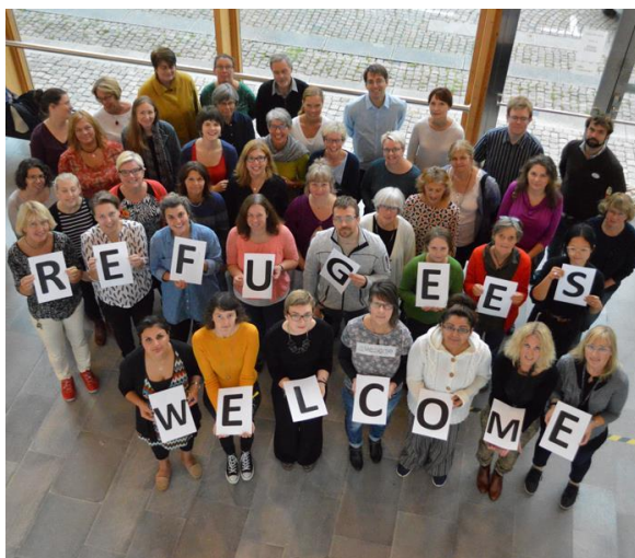
Slika 2. Refugees welcome 53

Jedna od europskih država s najvjerojatnije najduljom tradicijom narodnih knjižnica i raznovrsnih knjižničnih usluga jest Velika Britanija. Britanska knjižnična zajednica osmislila je program pod nazivom Dobrodošli u svoju knjižnicu ( www.welcometoyourlibrary.org.uk ) s namjerom da se narodne knjižnice povežu s izbjeglicama i azilantima. 54 Taj je program 2003. godine pokrenut kao pilot-projekt u suradnji pet londonskih gradskih općina, a do kraja 2007. godine proširen je na čitavu zemlju. 55 Projekt je financirala Zaklada Paula Hamlyna, a koordinira ga Agencija za razvoj londonskih knjižnica. 56