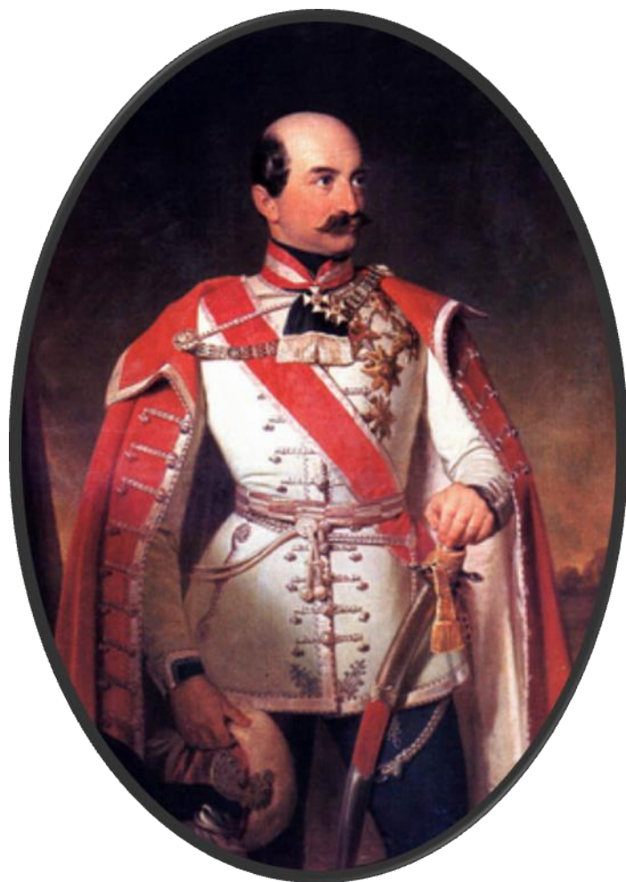
Prilog 1.: Portreti bana Josipa Jelačića