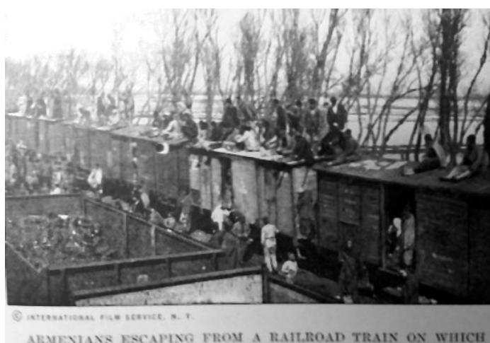
Prilog 5. Transport Armenaca u logore.