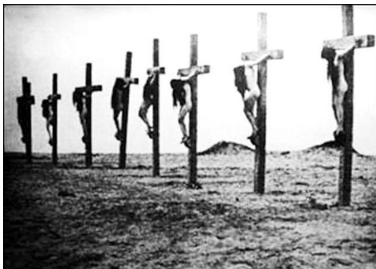
Prilog 8. Silovane armenske žene, potom pribijene na križ.